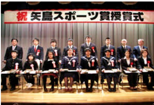
受賞された皆さん おめでとーございました!!