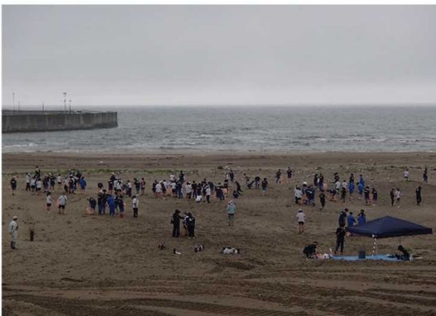
(多くの生徒が参加しました)

7月1日(金)、岩城中学校全校生徒および岩城小学校5・6年生で「道の駅岩城」下の海岸のクリーンアップを行いました。プラスチックごみや網など様々なごみを額に汗を流しながら回収し、最終的には2tトラック1台では収まりきれないほどのごみが集まりました。