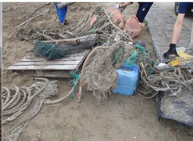
(たくさんのごみを回収しました)