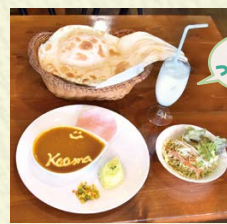
ラッシー ついてます!