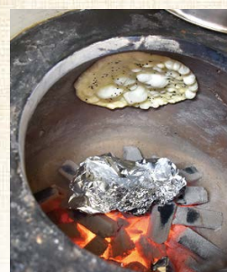
「タンドール」と呼ばれる窯の内側にナンをはり付けて焼く