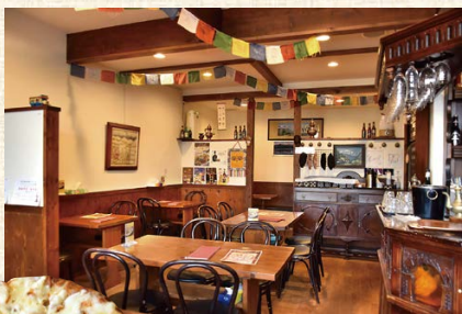
ネパールらしさがあふれるやさしい雰囲気店内

たくさんのお客様にお店に来てもらい、ネパール料理を知ってもらえるように頑張っていきたい。