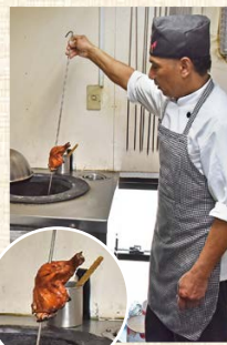
焼き上がったタンドリーチキンを窯から取り出す

ネパール人の料理人が作るネパール、インドのカレー。母国から輸入した調味料を混ぜ合わせて作ったカレーは本場の味わいで、ネパールの代表的なタリーというスタイルで提供しているのは県内ではここだけ。もう一つのおすすめは自家製ヨーグルトで作るラッシー。さまざまなフルーツを入れて作るラッシーはお客様にとっても好評です。チョコ