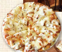
スパイスが効いたチキンティッカピザ