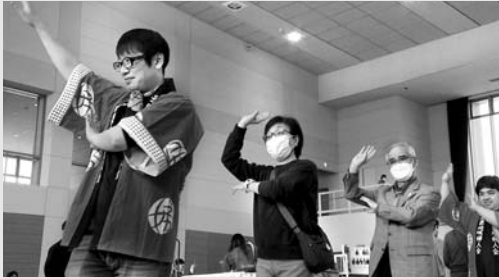
「おうち春まつり総集編 ～令和に復活！大内音頭～」

4月13日(土)に由利本荘市総合体育館で行われた「おうち春まつり」。かつて大内地域で行われていた夏祭り「芋川まつり」を復活させ、若者たちが地域に愛着を持つきっかけになればと、由利本荘プロモーション会議おうち春まつり実行委員会が企画。2回目の開催となったことは昨年より規模が拡大し、フィナーレには懐かしい「大内音頭」をみんなで踊るなど、大いに盛り上がりました。番組では当日のイベントの様子のほか、準備の様子や来年の開催に向けた実行委員会の意気込みをお届けします。