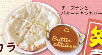
チーズナンと バターチキンカレー