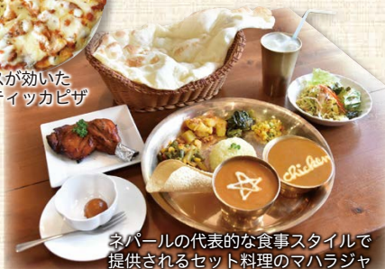
ネパールの代表的な食事スタイルで提供されるセット料理のマハラジャ