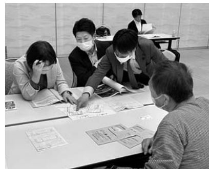
昨年の個別相談会の様子