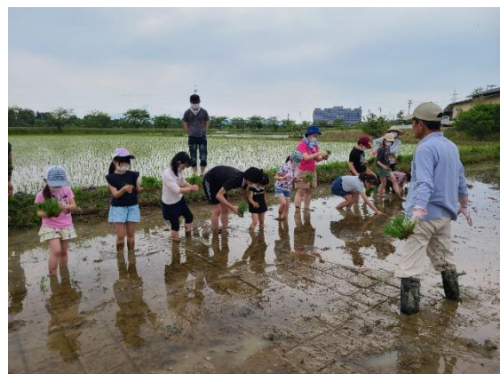
↑ 令和4年度田植え体験の様子