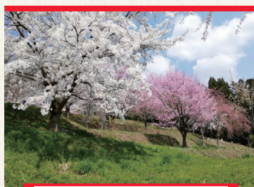
住みよい環境づくり