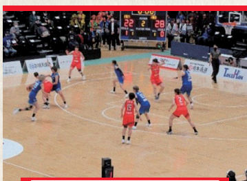
トップリーグ公式戦開催