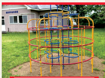
子育てしやすい環境づくり