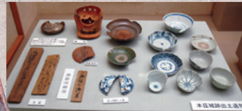
▲本荘城跡(本荘公園)で出土した江戸時代の遺物