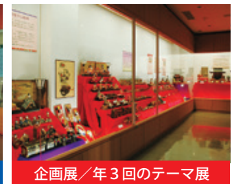
企画展 / 年3回のテーマ展