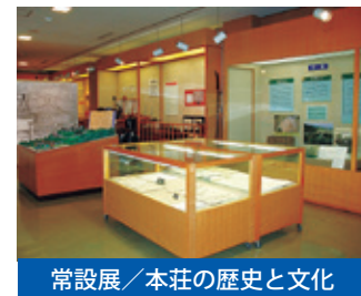
常設展 / 本荘の歴史と文化