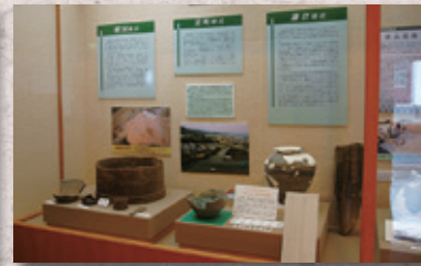
▲中世の本荘と考古資料 (大浦遺跡ほか)