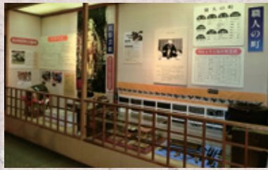
▲桶職人・下駄職人の技と道具