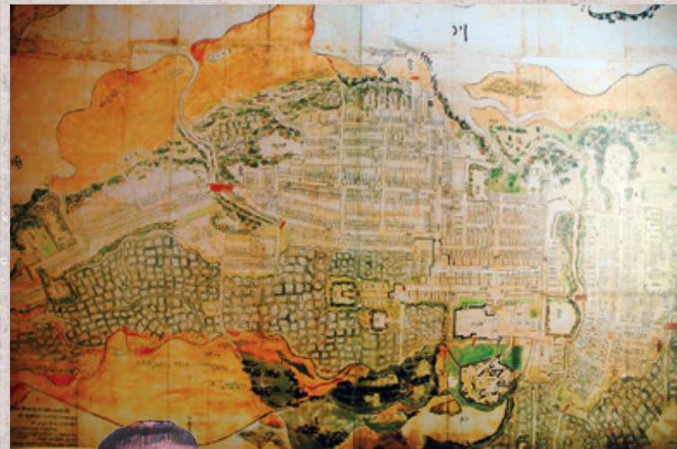
▲市指定文化財 本荘城下絵図(複製・江戸時代18世紀初頭)