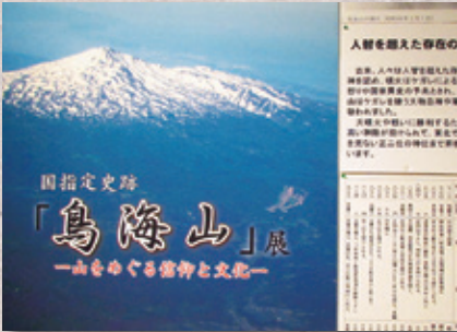
▲国指定史跡 鳥海山