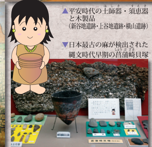
▲平安時代の土師器・須恵器と木製品 (新谷地遺跡・上谷地遺跡・横山遺跡) ▼日本最古の麻が検出された縄文時代早期の菖蒲崎貝塚