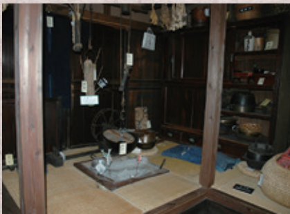
▲昔の暮らしをのぞいてみよう (いろいろのある部屋とわらの道具)