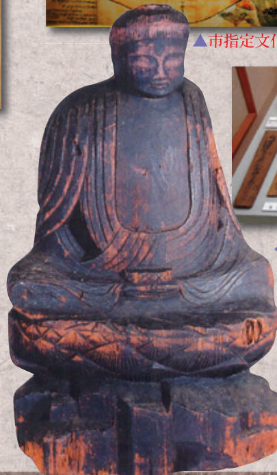
▲市指定文化財 聖観音(円空仏)