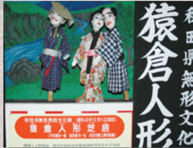
▲秋田県無形民俗文化財 猿倉人形芝居