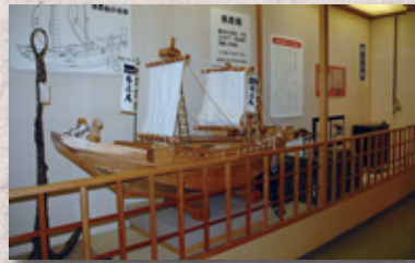
▲日本海と子吉川の舟運で活躍した帆前船