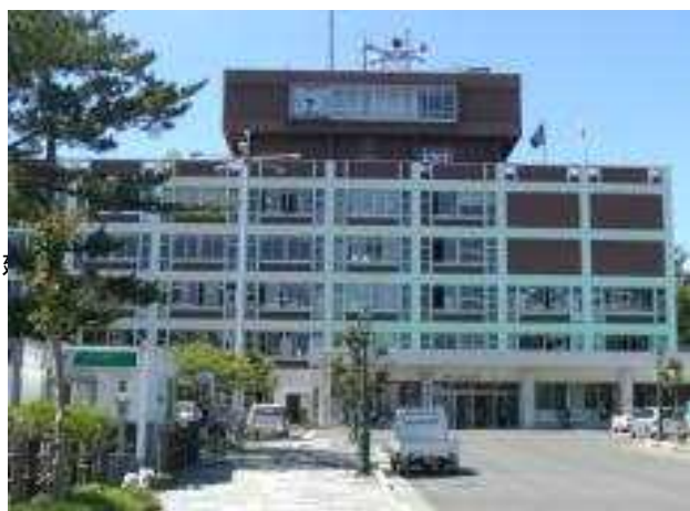
由利本荘市役所本庁舎