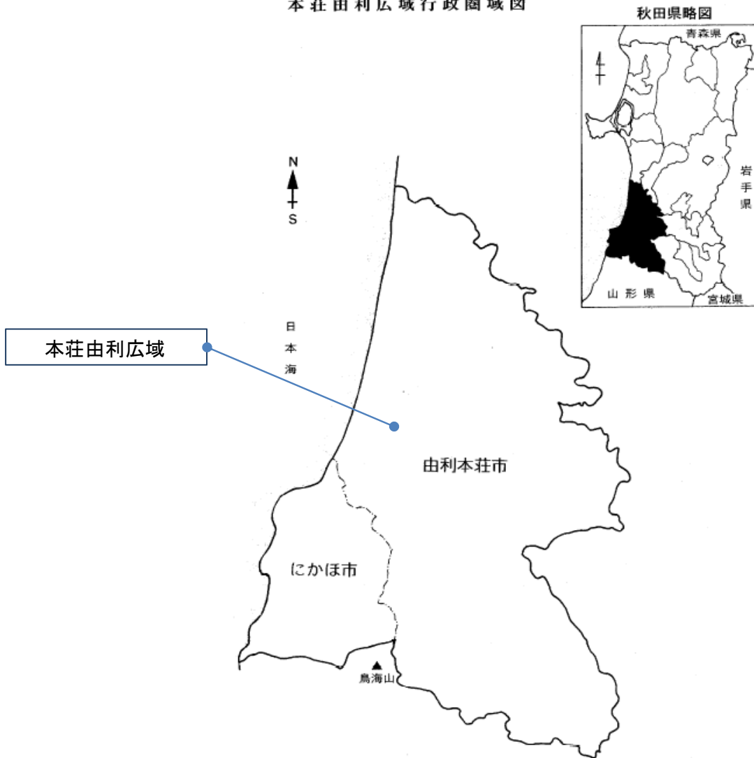
本荘由利広域行政圏域図

本荘由利広域市町村圏組合は、由利本荘市、にかほ市をもって組織し、し尿処理施設、養護老人ホーム、特別養護老人ホーム、広域行政センター、休日応急診療所、埋立処分地施設、家畜保冷施設、産学共同研究センターの設置及び管理運営と介護保険者事務を行っている。