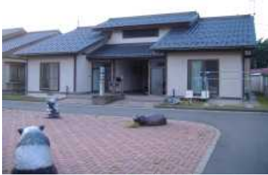
木造住宅の耐震診断・改修補助