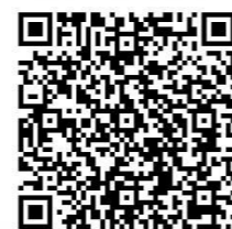
旅行村 Instagram(上) 市ホームページ QR(下)

縦横 2.5m 四方、高さも 2m 以上あるので 大人 6 人でもゆったり入れます！ ★アロマ入りのロウリュもできますよ★