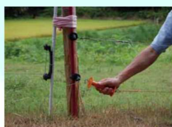
侵入防止柵の設置