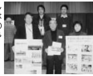
「本荘・由利カヌークラブ・秋田県立大学カヌー部」(グランプリ受賞)の発表