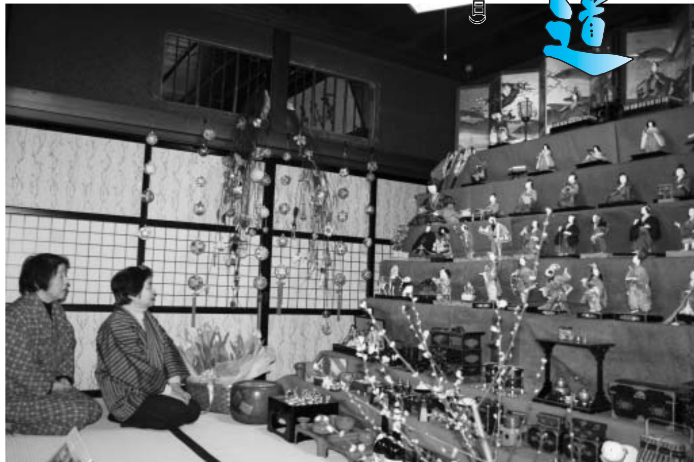
昔ながらの文化を伝えるひな人形をご堪能ください(昨年の「由利本荘ひな街道」——矢島・大井家)

各地域で大切に受け継がれてきた昔懐かしいおひなさまに会いに「おひなつこめぐり」を訪れてみませんか。「町中ひなめぐり」の各展示会場は、別表のとおりです。「町中ひなめぐりマップ」は各資料館・公民館などに置いてあります。