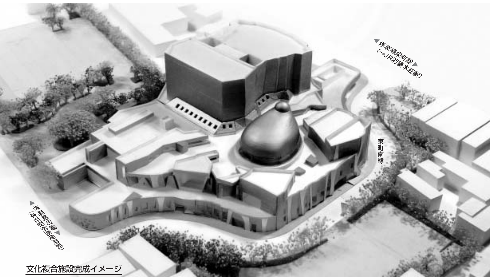
文化複合施設完成イメージ

同協議会の中では、「由利本 荘の象徴、新市の文化拠点施 設にしてほしい」、「文化会館、 図書館などとともに検討すべ き」、「大人から子どもまで、 気軽に立ち寄れる施設に」 「学童保育の場としての利用 も」、「合唱や演奏の練習など、 防音設備の整った部屋がほし い」、「小会議室を多く整備し た方がいい」、「堅苦しくなく 利用できる図書館に」などの 意見が寄せられ、多機能ホー ルへと見直しするなど、貴重 なご意見をできる限り計画に 反映させています。