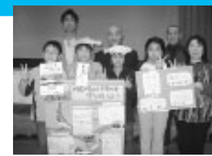
グランプリを受賞した「由利小学校はかせクラブ」(上)と「西滝沢子ども水辺協議会」

各地域で「水」にかかわる活動を行っている立場の異なる人たち（NPO、教育機関、企業、行政）が交流を深め、地域の環境保全について学ぶ、北東北「川・水環境」ワークショップが一月三十一日、二月一日の両日、アクアパルを会場に開催され、県内から十四団体・一個人、約百人が参加しました。 「由利小学校はかせクラブ」（6年生4人）は、「川底の見える子吉川」を守り続けていきたいと発表。見事子ども部門のグランプリに輝きました。一般部門では「西滝沢子ども水辺協議会」と「本荘由利カヌークラブ・秋田県立大学カヌー部」がグランプリを受賞し、三団体が全国大会に出場することになりました。