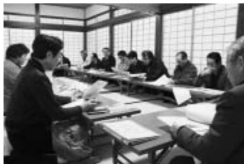
矢島共通ひなめぐり券やパンフレットなどについて話合った矢島ひなめぐり実行委員会展示・おもてなし部会(2月3日、鳥海山麓地区総合案内所)