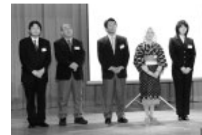
応援大使の皆さん

第二十二回岩城綱引き大会が二月一日、岩城総合体育館で行われ、各町内などから八チーム、八十人が参加、「よしよ！よしよ！」と威勢のよいかけ声で綱を引き合い、町内同士の親睦を深めました。決勝は川南チームと道川チームの対戦。好ゲームとなりましたが、地力に勝る道川チームが三年ぶりの優勝を飾りました。どうしても運動不足になりがちなのこの季節。参加者は心地よい汗を流し、会場は熱気にあふれていました。