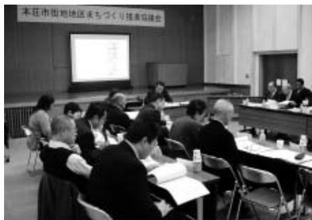
検討を重ね、意見の集約を図った協議会

平成十九年度には市議会に 基本設計の内容を説明し、富 山県黒部市の国際文化センター 「ミライ」などを視察ののち、 八月に市民説明会を開催。実 施設業務を委託しました。 本年度は実施設計がまとま ったことから、基本設計と同 様に七月に議会説明会、八月 に市民説明会を開催。十二月 に市議会の議決を得て、この ほど建設工事に着手となりま した。