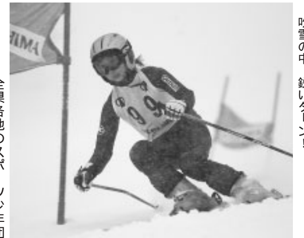
吹雪の中、鋭いターン！