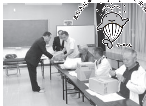
南内越地区で行われた資機材貸与の様子(9月26日)

防災資機材は、ヘルメット、メガホン、アルミカート、レスキューボードの4種類で、各自主防災組織の実情に応じて、この中から1種類を選んでもらい、災害時はこちらより