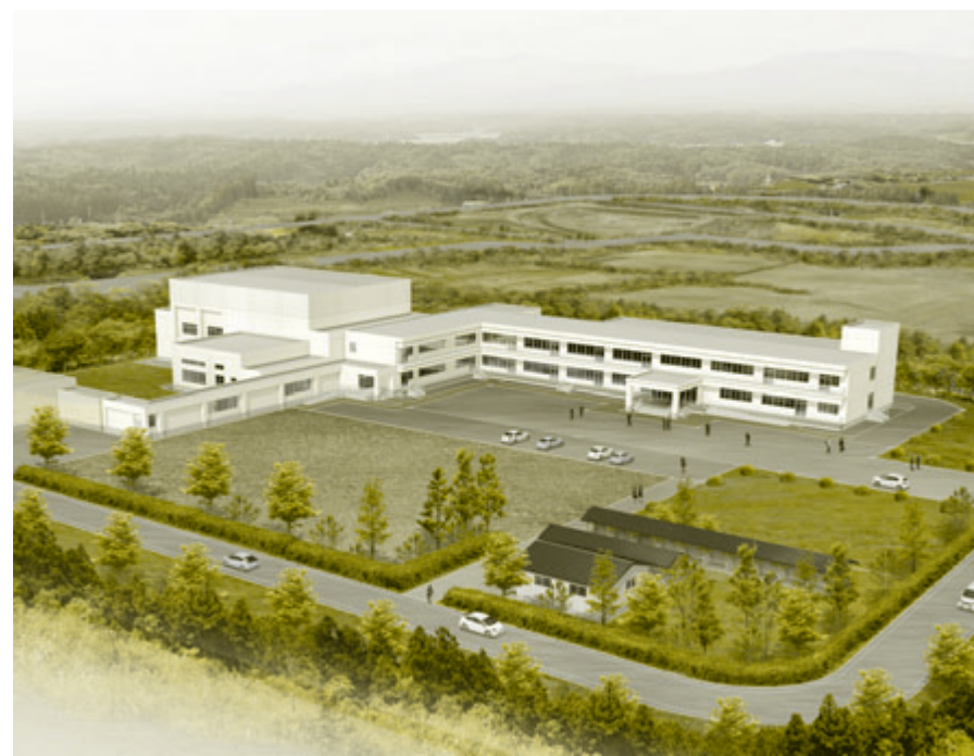
東由利中学校 完成予想図

耐震化率100パーセントに向け工事を開始 平成27年の完成を目指し東由利中学校改築工事の起工式・安全祈願祭が9月24日、東由利老方字台山の工事予定地で行われました。新校舎は鉄筋コンクリート2階建て、延べ床面積が約4711平方メートル、校舎棟・体育棟・必修