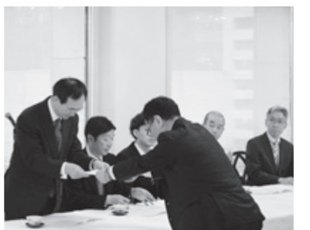
委嘱状交付の様子

会にはふるさと応援大使や来賓、各地域のふるさと会代表者など27人が出席。情報交換では、市からは今年度の事業や今後の主な取り組みなどが報告されました。応援大使からは「由利本荘市はシェールオイルのニュースで有名になっている」、「うまいもの酒場が好評」、「研究者になれたのは小学校教育のおかげ」、「森林整備や経済の学習で連携を深めたい」、「漫画を通じて交流の機会を作りたい」などの報告が寄せられました。また、今回は東京営業所を持つ株式会社三業機械が初参加し、企業ネットワーク構築に向けても意義深い会となりました。