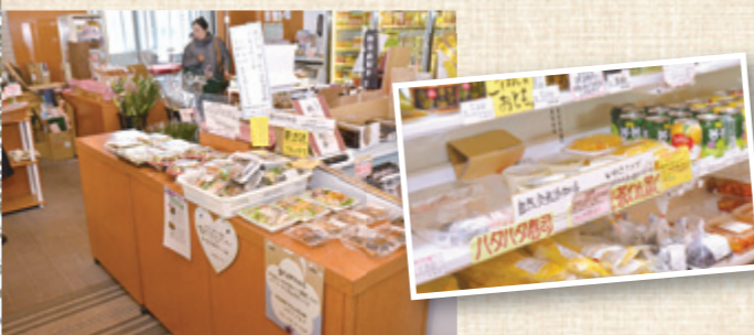
「ゆりぶらざ」での販売の様子。