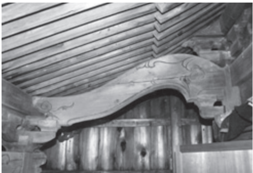
宮内「八幡神社」の海老虹梁（えびこうりょう）

最後に、本市の矢島町荒沢 「八幡神社」、宮内「八幡神社」、 赤田「長谷寺大仏殿」、松ヶ 崎「八幡神社」それぞれの「虹 梁」などを写真で比較。聴講 者たちは、施された装飾や彫 りの特徴による年代判定のポ イントを確認していました。