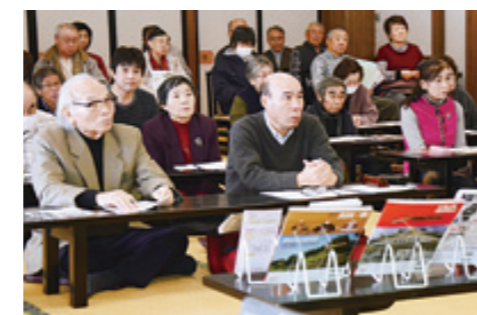
約90人が亀田の魅力を確認した歴史講座

大河ドラマの放送が始まった1月から、亀田地区を訪れるグループや夫婦連れが急増。まち歩き案内人の団体予約も順調で「真田丸」効果が表れてきています。