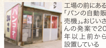
工場の前にある「パンの自動販売機」。おじいさんの発案で20年以上前から設置している

ムーランでは、店内でパンを食べることもできる。コーヒーはサイフォン式で1杯ずつ入れる本格派