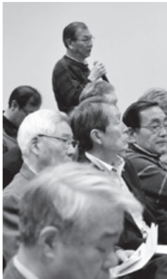
いただいた意見をこれからの市政に活かしてまいります

廃校となる上川大内小の活用策を提案してほしい。 A 地域活性化や人材育成の拠点となるべく、今後も話し合いの機会を設け、地域の皆さんの声を聞きながら活用策を探っていきたい。 Q 子どもの遊び場を作って