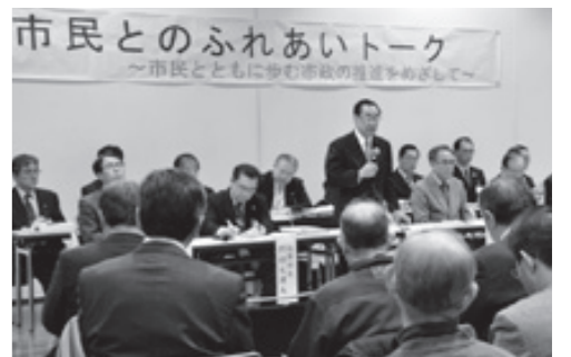
本荘地域ふれあいトークの様子(1月15日)

少子化、人口減少に伴い、町内会の統合・再編を進めてほしい。 Q 少子化、人口減少に伴い、町内会の統合・再編を進めてほしい。 A 独立した自治組織であるため、自治体の主導による