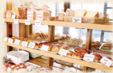
毎日、20〜30種類のパンが並ぶムーランの店内

パン作りへのこだわり パン作りは粉の配合から全て自社で行う「スクラッチ製法」。納入先によって、材料の配合は変わるし、時代とともにお客さまが好むパンも変化している。地元食材を使いながら、季節ごとに新しいパンを作り、お客さまを楽しませたい。