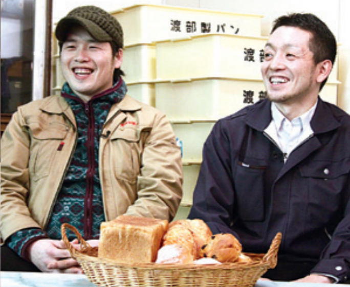
「お客さまにいろいろパンを食べてほしい」と話す祥彦さん(左)と剛さん(右)

矢島地域の佐藤酒造店では、2月13日に開催された酒蔵開放で一足早く先祖伝来の「享保雛」をお披露目。矢島藩地代から受け継がれた雅やかなひな人形に、訪れた人たちは目を細めていました。