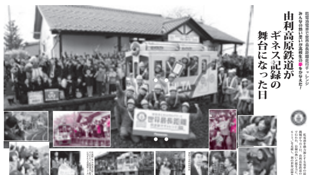
山利高原鉄道がギネス記録の舞台になった日