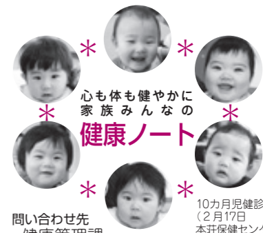
10カ月児健診(2月17日 本荘保健センター) 問い合わせ先 健康管理課(本荘保健センター内 ☎22-1834) または各総合支所市民福祉課へ

【持ち物】母子健康手帳・アンケート票・バスタオル ※3歳児健診を受ける方は、ご家庭でアンケート票の中の聴力と視力の検査をしてきてください。