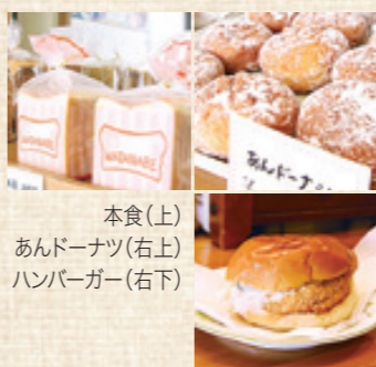
本食(上) あんドーナツ(右上) ハンバーガー(右下)

おすすめ、定番の一品 本荘由利地域の給食用のパンを一手に引き受けているほか、スーパーや直売店「ムーラン」での販売用などがあり、1日に焼くパンの数は2〜3000個。 おすすめは本食(食パン)。2.5センチくらいに切り、トーストすると、もちもちの食感と粉のうまみが味わえる。定番はあんドーナツ。自家製で練っているあんこは時代に合せて甘みを変えているが、根強い人気商品。総菜パンの中でも、ハンバーガーはロングセラー。メンチカツと甘めのマカロニサラダが好相性。