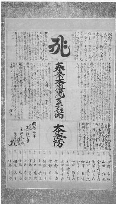
写真 掛軸・奉祭本海流系譜

本掛軸の文が記されたのは、神仏分離令が發布された翌年の明治二年である。全国で廃仏毀釈の機運が高まる中、矢島十八坊の一つである荒沢の矢越八幡寺別当矢越隆英も、明治三年二月には神祇官より裁許状が発行され神職に転じた(矢越隆弘家文書)。戊辰戦争の混乱につづく社会、宗教基盤の大換期に本掛軸は記されている。