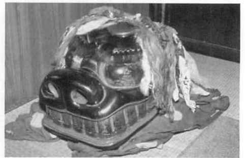
写真5 鳥海町小川・明暦の獅子頭 (1992年撮影)

三船家では背後のソンプツ山に黒石神社を祀っていて、この神社をソンプツ様ともいい、尊仏の文字をあてている。『鳥海山逆峯十八坊由緒之事』「合掌寺由緒之事」（榊家文書49）の項に「孫佛石仏」と記している。獅子頭の「孫佛」という銘から、この獅子頭ははじめから合掌寺（多宝院）のものであったこと、したがってこの地に、明暦の頃には獅子舞が行われていたことを示している。同由緒之事には「檀那地之儀ハ小川村分不残祈願致来候事」とあり、小川村の村回り（家々回り）の祈禱に用いた獅子であることが推察される。小川にはかつて小川番楽があった。多宝院の獅子は隠居獅子とされており、修験の獅子と村の番楽とが関係性を持っている。修験というと厳めしく