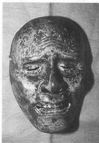
写真2 山谷番楽 一透作「姥」(1993年撮影)

生面神社の祭神は造化三神、天照大神ほかであるが、一五面の番楽面も御神体だといわれ神殿に納められている。ほかの番楽伝承地の番楽面とは異なり、古い能面系の面であるところに特色がある。これらの面のうち、大癒見 おおおほしみ に「大信」の刻銘、橋姫 はしひめ （鈴木三郎）に使用に「天下第一是閑」の焼印、姥 おば （写真2）に「洪手 一透作 兵庫」の刻銘、増とされる女面（写真3）