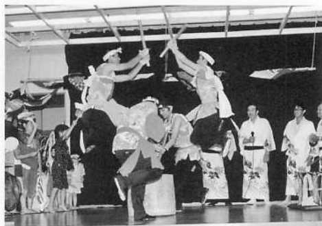
写真22 釜ヶ台番楽「四人空白」(空白からみ)