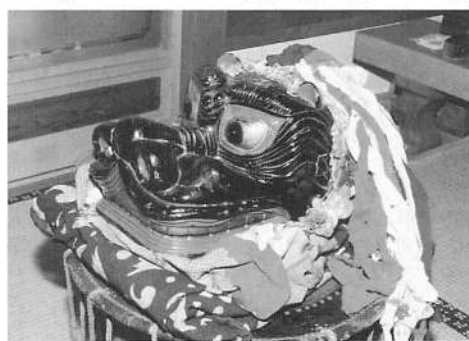
写真9 荒沢の獅子頭

にかほ市象潟町本郷の旧修験威徳院には、翁・三番叟と獅子頭が残されている。獅子頭は御宝頭系であろうが、翁・三番叟面は番楽に用いたものであろう。