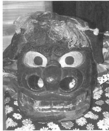
写真6 種の権現獅子(2003年撮影)

能代市二ツ井町種に「熊野神社大権現」と呼ばれる獅子頭がある（写真6）。「熊野神社大権現について」という種郷土芸能保存会の記録（平成十四年六月）によると、種には今も「法印様の家」といわれる家があり、当主は一四代目となるが、一〇代目まで「千手院」（千光院）といっ