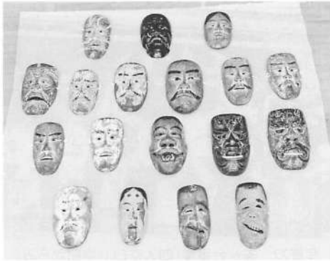
写真19 小滝番楽の番楽面

この演目は「鐘巻」を改変した、小滝院主の創作によるものと推測される。「鐘巻」では山伏が験力をもって鬼神を祈り伏せる。「修験舞」も修験の験力を示すことに主眼がおかれている。修験村であった小滝の地域性を反映した演目であるが、院主み