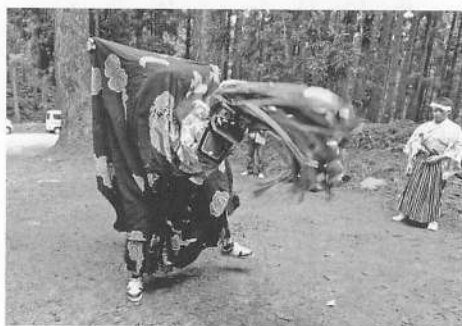
写真15 濁川獅子舞(虫除け祭り)

矢島町の濁川獅子舞は、かつては番楽も行き、濁川番楽と称していたが、現在は獅子舞だけを行っている（写真15）。鳥海山の矢島口の途上にあるもともと戸数が少ない集落で、昭和四十年頃までは、濁川七戸、野際一戸、中石滝一戸の三字一戸で獅子舞番楽を行っていた。その後戸数が減ったこともあって、番楽は昭和五十年頃を境に休止した。現在は、盆の入りの八月十三日に午後四時頃から十時頃まで濁川、大谷地、中石滝の一〇戸