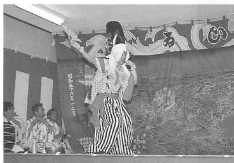
写真16 屋敷番楽「先番楽」

獅子舞に次いで、番楽の最初の舞として露払の舞を舞う。露払の舞の名称は、他の舞に比べて異同が大きい。また着面のところと、素面（面を着けない）のところがある。烏海山北麓の番楽では「先番楽」と呼び、素面の一人舞で、烏帽子を被り、襷掛け、刀を腰に差すという出立ちのところが多い（写真16）。濁川番楽のように二人舞であるのは番楽全体を見渡しても珍しいといえる。次表に示した