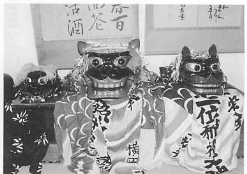
写真12 横岡の獅子頭(左・やさぎ獅子、中央・大人用、右・子供用)