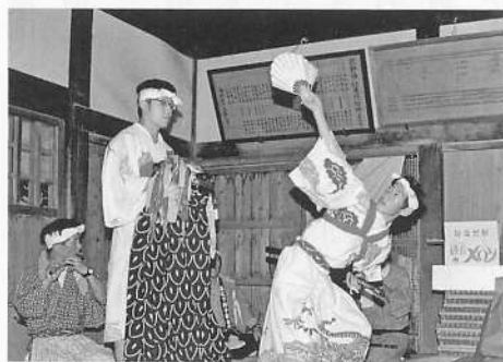
写真14 坂之下番楽「神舞」

下百宅番楽の伝承によると、獅子舞には「天地和合」「竜門の振り返し」「三条のみこし」という三種の舞の型があるという。天地和合は顎を打ちつけて歯打ちをすること、竜門の振り返しは獅子頭を左右に振り返すこと、三条のみこしは低い位置から獅子頭をもたけ、高く獅子頭を掲げて少し俯いて静止する型をいう。他の伝承地でこの舞の型の名称を聞くことはないが、本海流獅子舞にはほとんどの獅子にこの型がみられる。