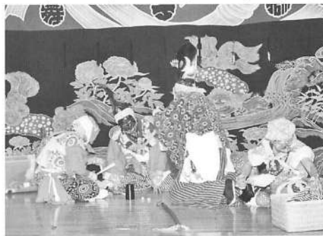
写真20 釜ヶ台番楽「ばくち三番」

二人の姉妹が親の仇討ちをする「団七」（志賀団七）は、屋敷番楽と横岡番楽が伝える（写