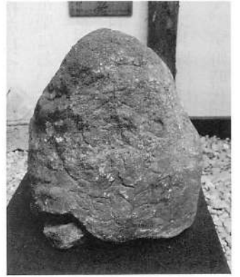
写真11 本海行人・安永8年の石碑

た 3) 。また、かつて白山長根に置かれていたという自然石の小さな石碑(写真11、現在は矢島町郷土資料館で保管)には「安永八亥 本海行人 三月十八日建之」と刻まれている。この石碑は一説には二百年祭の時のものと想定されているが 4) 、前に触れたように、安永八年(一七七九)頃には村々で獅子舞番楽が盛んに行われていたようである。そのような活発な伝承状況の中で、本海坊追慕の石碑だったことが推測される。