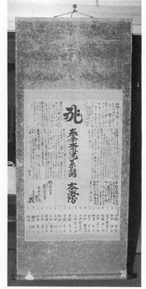
写真10 荒沢掛軸「奉祭本海流系譜」

坂之下、荒沢に伝授した後、天正六年（一五七八）に荒沢で死去したという伝承を書き留めている 1) 。百宅から荒沢にかけての村々の