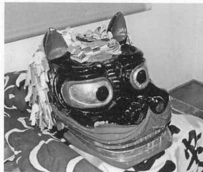
写真13 横岡・子供用の獅子頭

獅子頭は二頭とも髪が色とりどりの切り紙で作られていて、頭の上に木彫りの丸い金色の鏡を戴き、歯列に沿って金属の板が付けられている。番楽の獅子頭は布を裂いたものか、麻を髪とするのに対して、この点が異なる。横岡の歴代保存会長方の話によると、山形県遊佐町吹浦の大物忌神社に安置さ