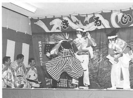
写真21 屋敷番楽「志賀団七」