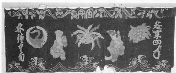
写真8 下百宅番楽・延享4年の番楽幕（1993年撮影）

由利本荘市域では矢島町の荒沢番楽の獅子頭に半車の紋が付いている（写真9、荒沢番楽については第七章参照）。この獅子は、かつて「八幡権現」と