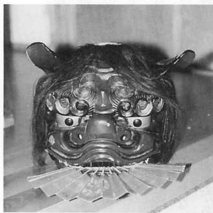
写真1 荒巻番楽の獅子頭(2002年撮影)

前の獅子頭は現在のものよりも小振りで、強く怖いような表情をしていて、相当振った痕跡が残っていたという。現在の獅子頭は全体が丸みを帯びていて、眉が太く渦を巻いているなど、外観は太神楽系の獅子頭に近似している（写真1）。