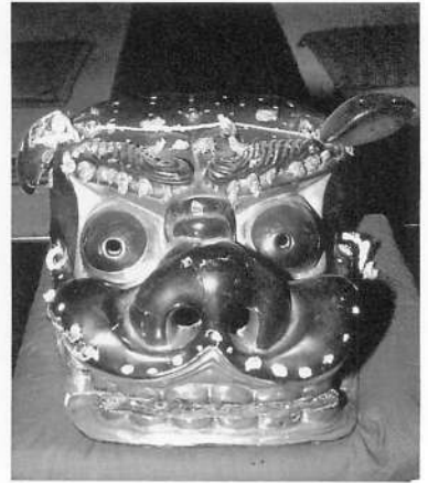
写真4 山田・南北朝の獅子頭 (1992年撮影)

加藤氏の話によると、この獅子は昔、三関村（現湯沢市）の八幡神社の獅子と喧嘩して、三関村の獅子を井戸に投げ込んだが、その際に右耳がとれたという。山田の獅子は喧嘩が強かったといわれ、稲川町（現湯沢市）麓の獅子とも喧嘩をしたと伝わるといふ。菅江真澄「雪の出羽路」に山田の獅子舞のことが書かれているが、それはこの山田八幡の獅子のことであろうか。同雄勝郡一「松岡郷」に記される「獅子塚」は、昔山田村の獅子と松岡（現湯沢市）の獅子が噛み合って闘い、敗れて倒れた松岡の獅子を埋めたところだという 3 。また同平鹿郡八に記す浅舞（現横手市）の獅子塚は、大森（現横手市）と山田の獅子が闘って、負けた大森の獅子を埋めたところだといふ。