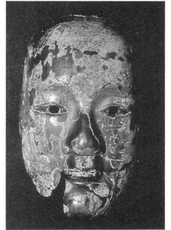
写真3 山谷番楽 イセキ作「増」（1993年撮影）

に「イセキ◇花押」の刻銘がある。「大信」については不明であるが、「是閑」は越前大野の能面打出目是閑（元和二年、一六一六没）、イセキ面は近江井関の能面打の作で中世末頃かと推測される。◇の形に彫った「知らせ鉦」、カタカナ井関と呼ばれるイセキの刻銘を持つ作品は各地に残っている。「洪手 一透作 兵庫」については、佐渡の本間寅雄氏が中世末頃の佐渡・洪手の領主足立兵庫と、同じく中世末に佐渡にいた一透という仏師との関連から検討されている 4) 。