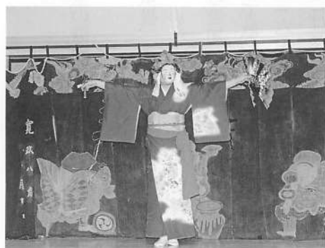
写真18 猿倉番楽「要揃」(若子)

いう。つまり、前半の七番が集落の作祭りにとって欠かせない神事的・儀式的な舞で、後半は直会後のくだけた雰囲気の中で楽しんで見る舞だといえよう。