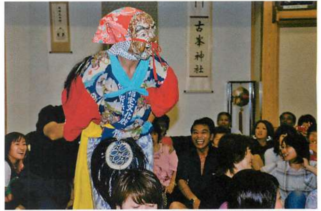
1. 番楽 (撮影：2007年8月20日)