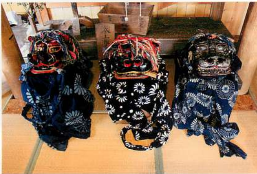
6.【東由利】舟打場獅子舞