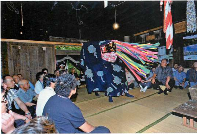
4. 木境大物忌神社虫除け祭りでの奉納