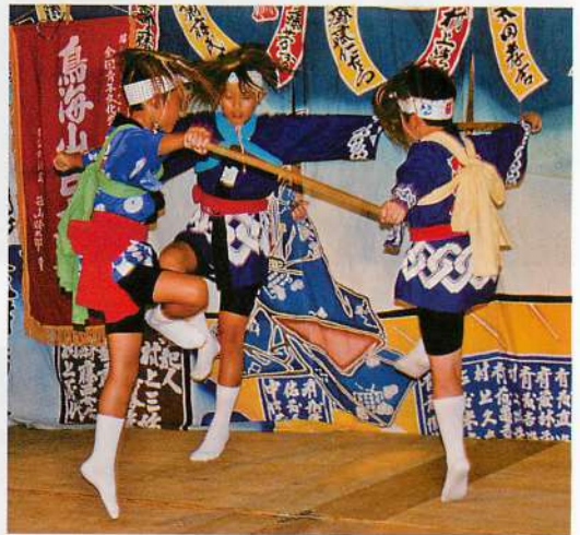
2. こどもたちの三人立