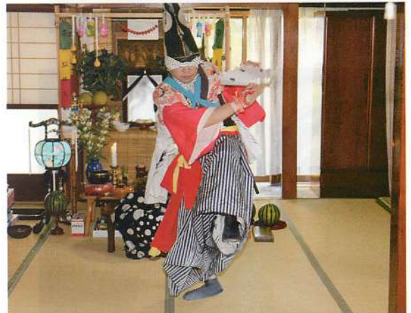
5. 初棚の家での拝舞