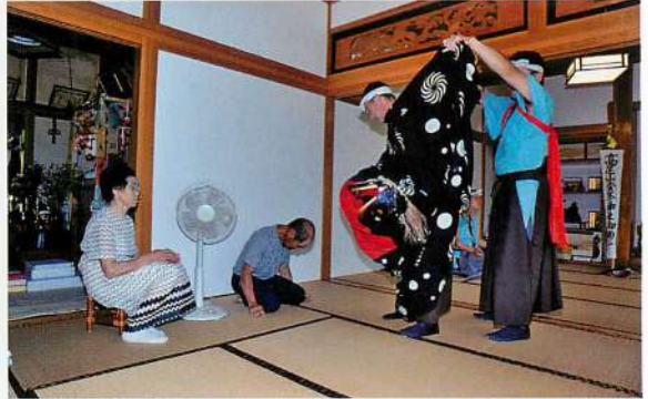
3.【大内】高尾山金峰神社御獅子・門廻し