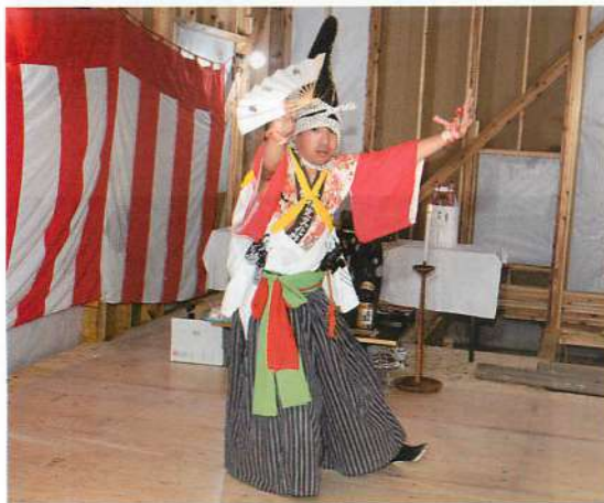
6. 柱がらみでの拝舞