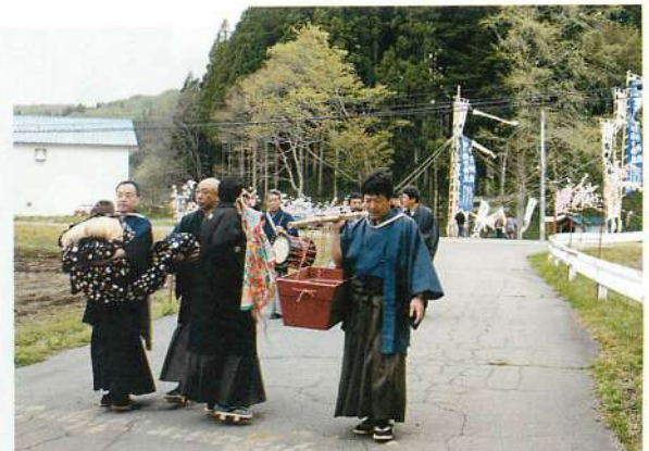
7. 御獅子神社祭礼のお下がりでの獅子頭巡幸