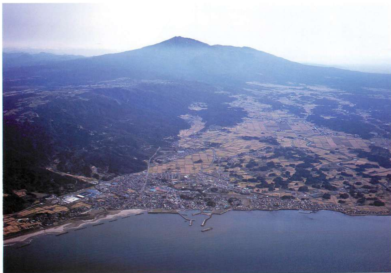
2. にかほ市の景観（仁賀保地域と鳥海山）