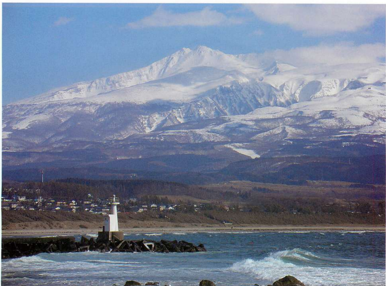
2. にかほ市象潟海岸からみた鳥海山