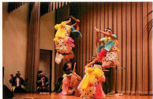
9.【鳥海】貝沢からうすからみ