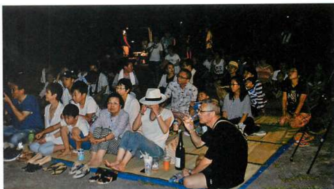
1. 番楽を楽しむ集落の人々