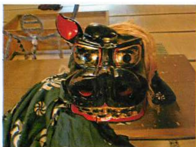
10.【由利】新屋敷獅子舞