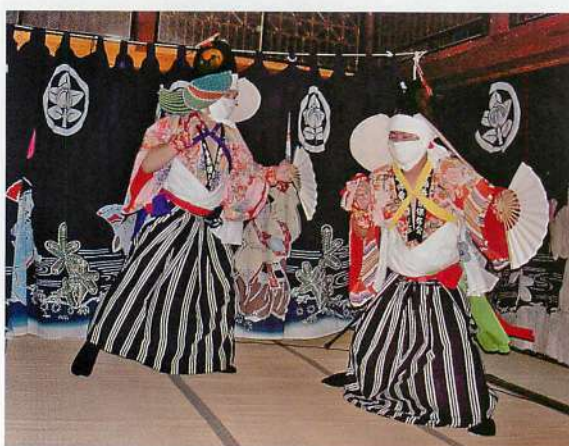
3. 鳥舞 (撮影：2003年8月19日)