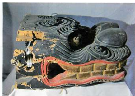
1.【本荘】二十六獅子舞