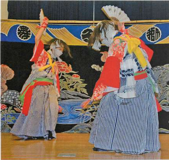
2. 二人舞 (撮影：2007年8月20日)