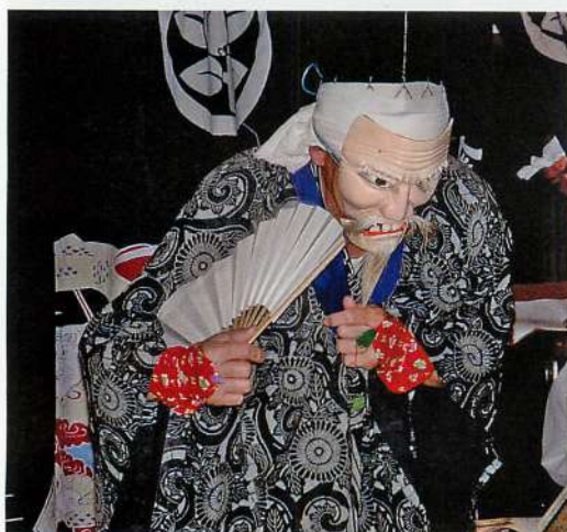
4. 翁 (撮影：2003年8月19日)