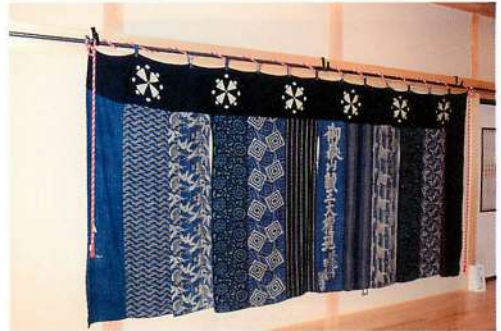
5.【東由利】地下ノ沢獅子舞・文久元年(1861)番楽幕