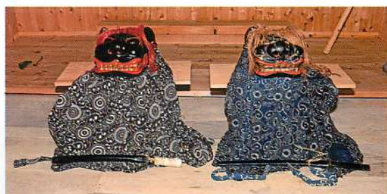
7.【岩城】富田月山神社獅子頭