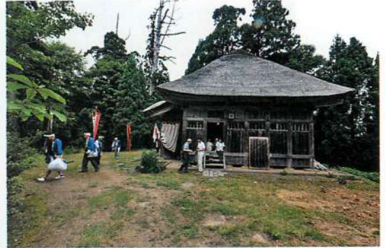
3. 木境大物忌神社の虫除け祭り