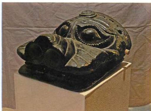
4.【本荘】土谷白山神社獅子頭