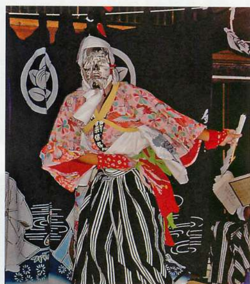
5. 三番叟 (撮影：2003年8月19日)