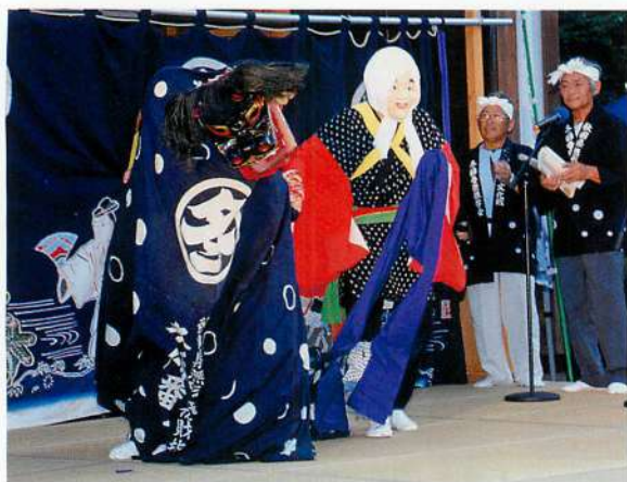
2. やさぎ獅子 (撮影：2012年9月1日)