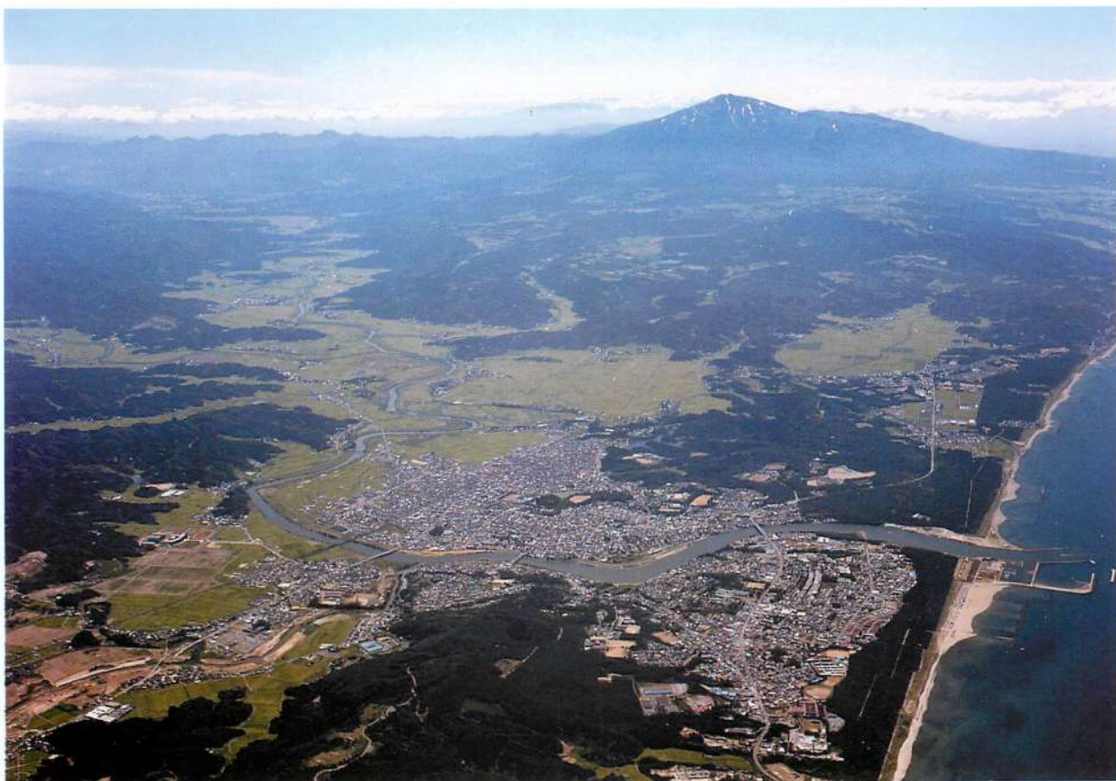
1. 由利本荘市の景観（本荘平野と鳥海山）