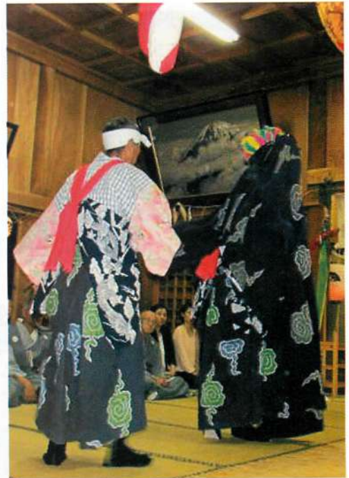
5. 矢島の八朔祭での奉納