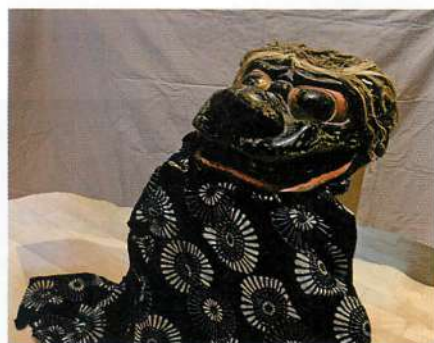
2.【本荘】雪車町番楽・延宝4年(1676)