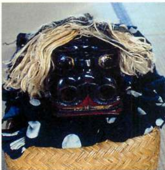
10.【仁賀保】水岡野獅子舞 (撮影：1993年)