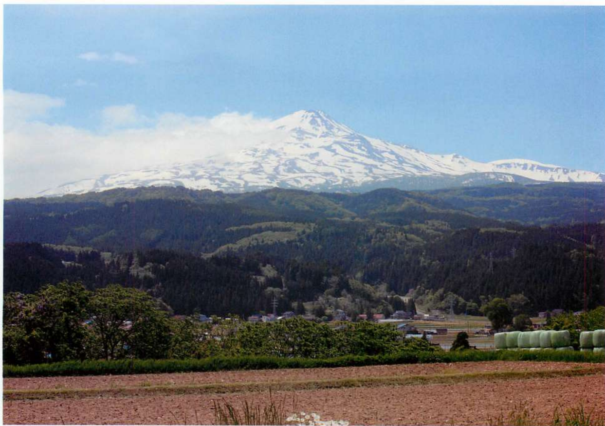
1. 由利本荘市矢島町からみた鳥海山