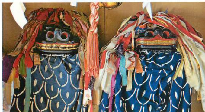
7. 獅子頭 左【隠居獅子】 右【現役獅子】