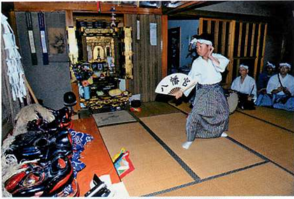
2.【大内】新沢八幡神社新沢番楽・門廻し「神舞」