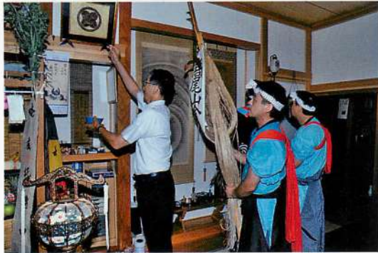
4.【大内】高尾山金峰神社御獅子・門廻し「柱噛み」