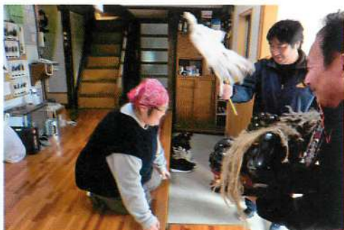
8.【岩城】滝俣獅子舞・御獅子廻し