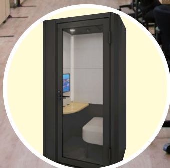
テレキューブ(防音室)