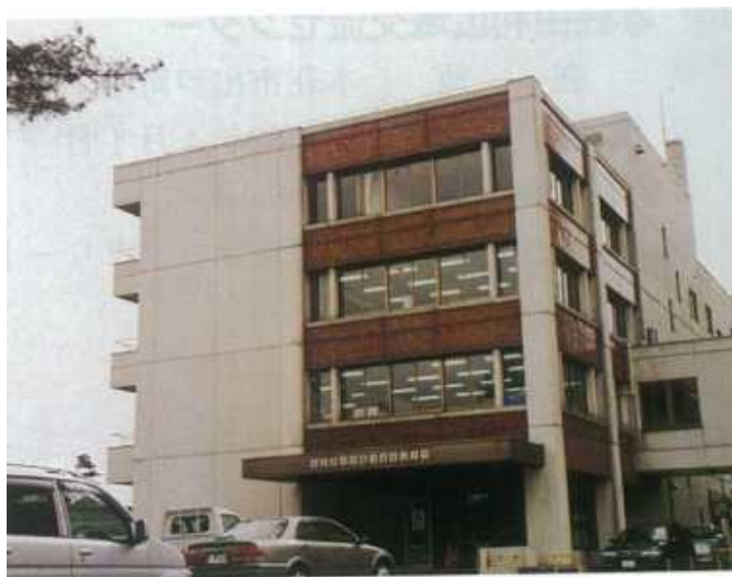
本荘由利広域市町村圏組合

本荘由利広域市町村圏組合は、由利本荘市、にかほ市をもって組織し、し尿処理施設、養護老人ホーム、特別養護老人ホーム、広域行政センター、休日応急診療所、埋立処分地施設、家畜保冷施設、産学共同研究センターの設置及び管理運営と介護保険者事務を行っている。