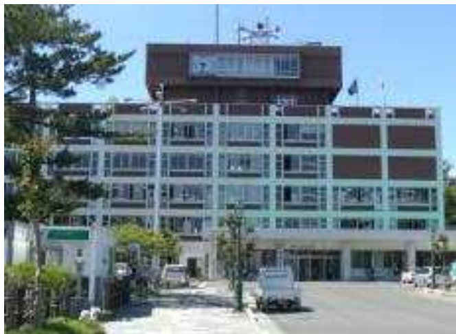
由利本荘市役所本庁舎

1-A1-1 住宅・建築物安全ストック形成事業 建築物の耐震改修等・由利本荘市本庁舎