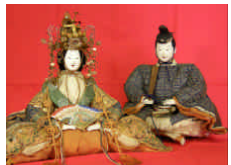
熊谷家(大川原)の古今雛