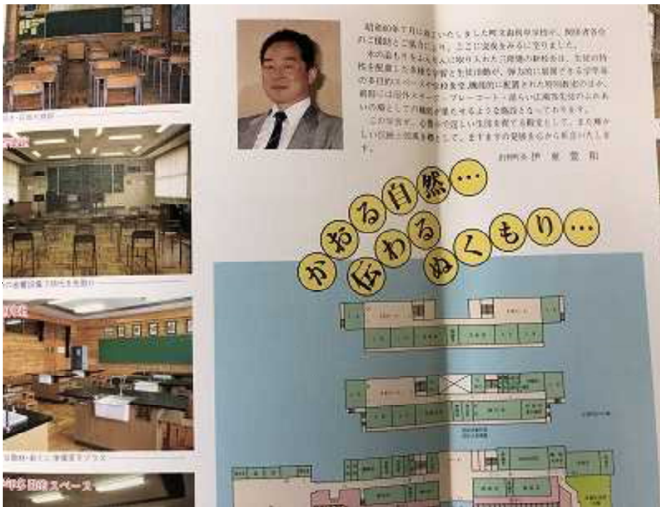
竣工パンフレットより

として、また輝かしい伝統と校風を礎として、ますますの発展をこころから祈念いたします。」とあります。 竣工から三十四年たつた今でも本校は、由利地域の文化の拠点として威風を放っています。が、食堂