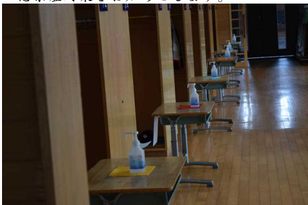
①登校時の手指の消毒

7・8日の午前登校日を経て、11日から本格的に学校が再開しました。子どもたちの元気な声が校内に戻り、大変嬉しく思います。感染拡大前と校内での過ごし方は変わりますが、感染防止に努めながら、子どもたちが楽しく安全に学校生活を送れるようにしていきたいと思います。学校での感染症対策をお知らせします。