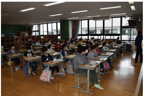
⑤教室での座席配置