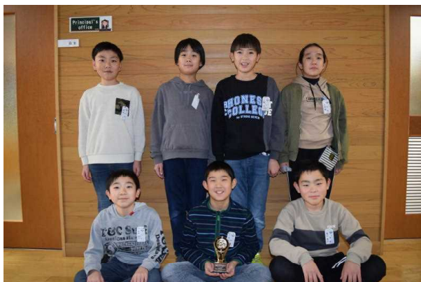
第31回バーモンドカップ秋田県大会 由利本荘地区予選 地区代表 由利GB