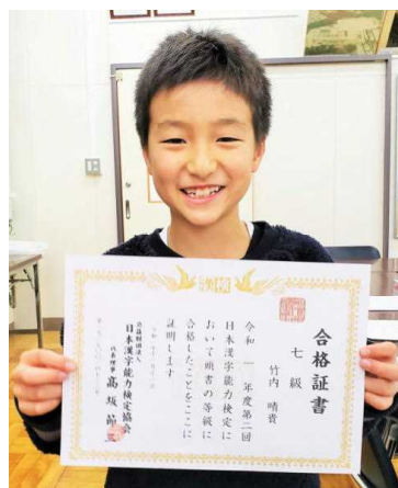
【令和1年度第2回日本漢字能力検定】 ＜七級合格＞ 3年 ○○○○さん