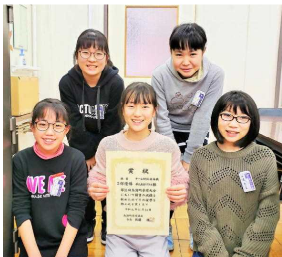
○新山卓球スポーツ少年団 【第31回鳥海町卓球大会】 ＜2部＞ 優勝 新山卓球スポ少A