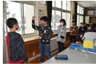
ジェスチャーゲーム