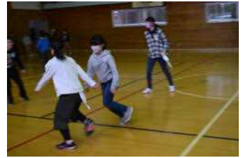
しっぽ取りゲーム