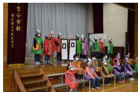
3年：夜のスーパーに 駆ける