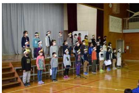
4年：解説お手紙付き 音読劇 ごんぎつね