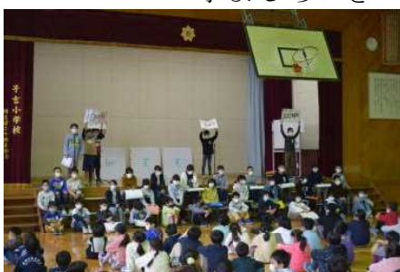
5年：見つめよう！ ふるさとの米作り