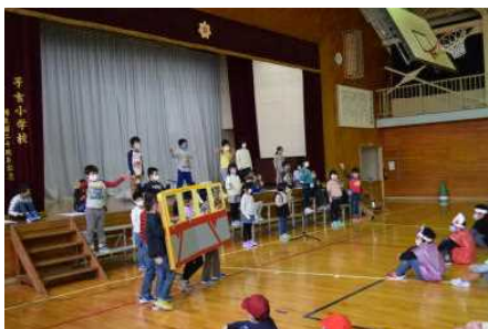
2年：いいところいっぱい 子よしちいき