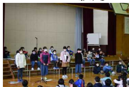
6年：Dreams come true ～私たちと環境～