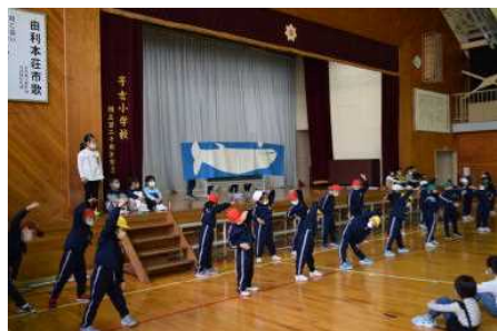
1年：くじらぐもにのって

駐車場、3密(入場・人数・座席・換気など)、寒さ対策と多くの心配・課題がありましたが、ご家族の皆様のご協力で無事に終えることができましたことに感謝申し上げます。