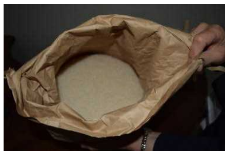
精米したばかりのひとめぼれ