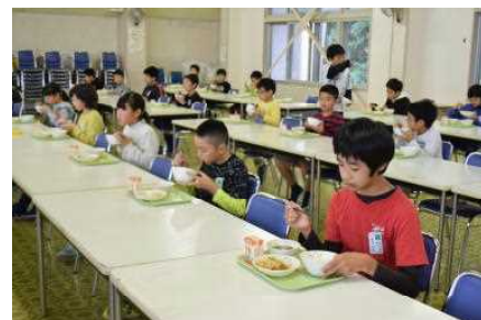
5年生は味わって・・・