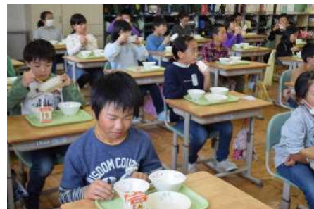
4年生：「もちもちしてる！」

10月9日（金）PTA・学年会計中間監査を行いました。 監査員の皆様、お忙しいところありがとうございました。