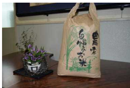
袋には「自慢のお米」

学校田を引き受け、子どもたちの稲作体験に快くご協力いただいた皆様に、心から感謝いたします。本当にありがとうございました。