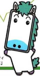
インターネットセーフティ PRキャラクター「うまほ」