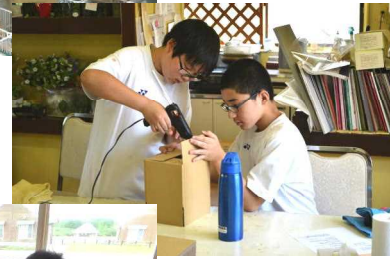
アイランドパーク