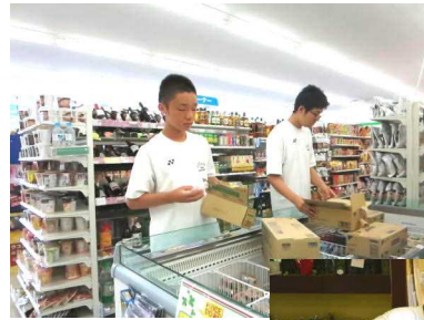
ファミリーマート