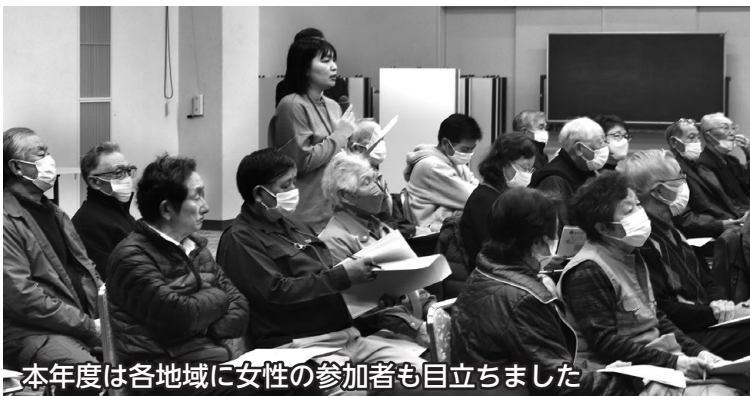
本年度は各地域に女性の参加者も目立ちました

市民を対象とした市主催広聴事業は「由利本荘市21年目に向けて」次期総合計画『(仮称)ゆりほん未来プラン』と題した共通のテーマを基に市長が講話を行い、その後講話に関する質問や市政に関する意見交換を行いました。 具体的には、人口減少対策、新ごみ処理施設建設、再生可能エネルギー、町内会の維持とあり方についてなど講話テーマのみならず、身近な問題など多様な分野にわたる発言がありました。(5ページ参照) 多くの皆さんからご参加とご意見をいただき、誠にありがとうございました。今後の市政運営に反映できるよう努力してまいりますので、引き続きご理解とご協力をお願いします。