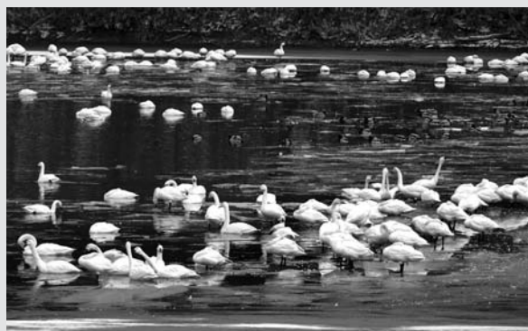
大堤ため池（2025年2月薬師堂水林）

冬 の朝、まだ空気が青く沈んでいる時間帯、ハクチョウのねぐらとなる水辺は最も美しい表情を見せます。冷えた空気が肌にやわらかくまとわりつき、もやの向こうからなまめかしい白が静かに浮かび上がる。