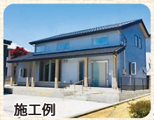
施工例 建築も一つひとつ丁寧に