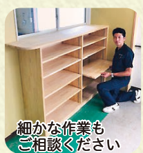
細かな作業もご相談ください