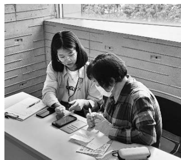
スマホなんでも相談会の様子

スマートフォンなどの基本的な操作、カメラ・二次元コードリーダー・地図など各アプリの使用方法を体験できます。