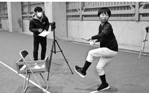
球速の測定と投球フォームチェックの様子

参加者は、野球経験者のス タッフから具体的な数値を基 にした正しいフォーム指導を 受け、パフォーマンスの向上