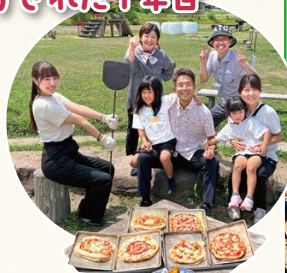
イベント参加の ご家族と石窯ピザパーティ♪