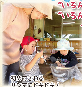
初めてさわる サンマにドキドキ!

“いろんなバックグラウンドの人がいる” “いろんなことに向き合っている人たちがいる” — 多彩な仲間魅了された 1 年目 —