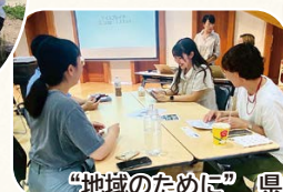
“地域のために”県内の協力隊研修などを通し、 感じ方や考え方に多様な変化がありました