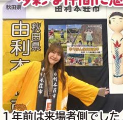
1 年前は来場者側でした!

“いろんなバックグラウンドの人がいる” “いろんなことに向き合っている人たちがいる” — 多彩な仲間魅了された 1 年目 —