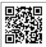
これまで、これからの活動はこちらから