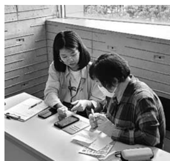
スマホなんでも相談会の様子