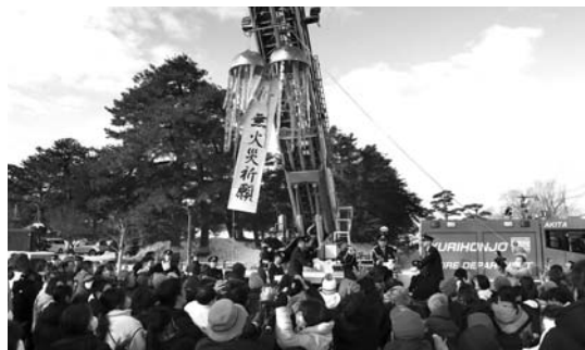
令和7年の様子（くす玉開披）