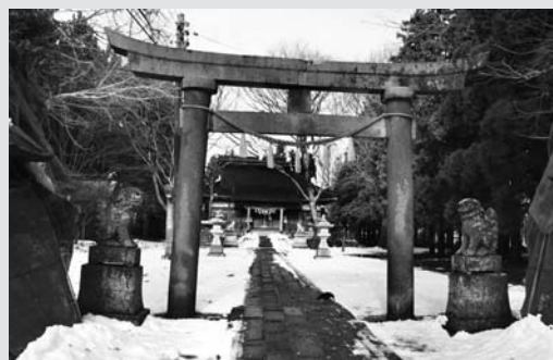
由利本荘市内にある「本荘八幡神社」。笏谷石の狛犬と自然災害伝承館が見どころ

日本には約8万もの神社があると言われています。これらの中にはジオパークの見どころ（サイト）になっている神社もあります。例えば、熊野那智大社と別宮の飛瀧神社（和歌山県）は、ご神体の那智の滝とともに南紀熊野ジオパークの見どころです。旧暦の10月に日本中の神様が集まるとされる出雲大社（島根県）は、島根半島宍道湖・中海ジオパークの見どころです。隠岐（島根県）や伊豆半島（静岡県）などのユネスコ世界ジオパークも、神社を見どころに含めています。それにしても、なぜ神社がジオパークの見どころになるのでしょうか？