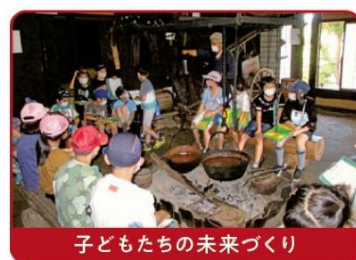
子どもたちの未来づくり