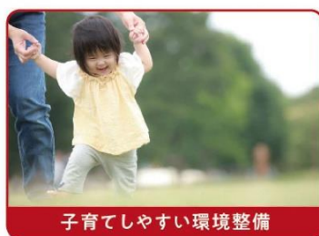
子育てしやすい環境整備