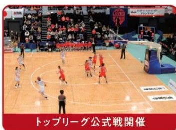
トップリーグ公式戦開催