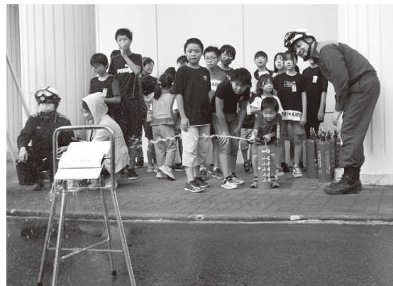
水消火器体験の様子

や濃煙が体験できる煙体験テント、給水車からの給水体験のほか、女性消防団や防災士、自衛隊由利本荘地域事務所による防災講話が行われました。 また、鳥海総合支所周辺では地震による天井崩落事故で傷病者が多数発生した場合の救助、救急搬送、ヘリ吊り上げ訓練や建物火災が発生した場合を想定した建物火災防ぎょ訓練、さらに協定を結んでいるあおいドローンサービストと佐川急