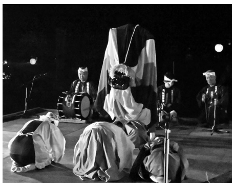
権現舞（高屋敷神楽）

送られました。また、昨年11月に行われた第71回全国民俗芸能大会に出演した、高屋敷神楽保存会（岩手県一戸町）が特別出演として舞台に上がり、約700人の観客は4時間の公演を楽しみました。