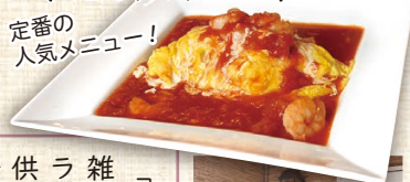
定番の人気メニュー!