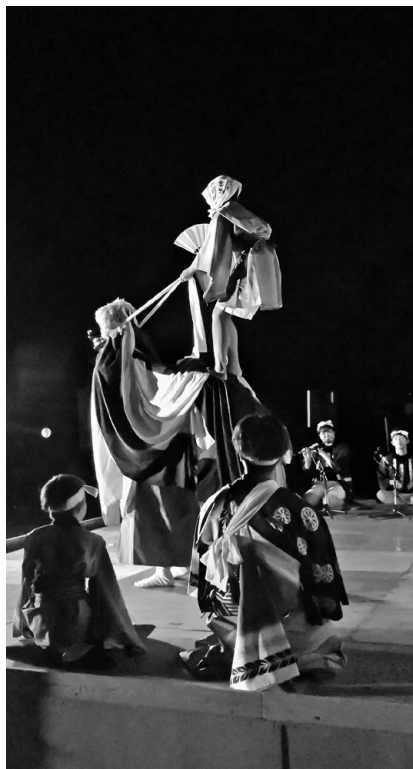
権現舞（高屋敷神楽）

催しには本海獅子舞番楽（国指定重要無形民俗文化財）の8講中が出演し、地域で受け継がれてきた舞いを披露しました。