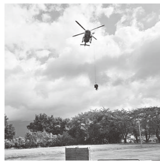
ヘリ吊り上げ訓練の様子

便本荘営業所による物資運搬訓練や、陸上自衛隊の炊事車と協力した赤十字奉仕団による炊き出し訓練なども並行して実施され、約2時間にわたる訓練が繰り広げられました。