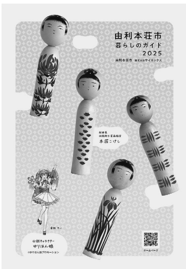
A4冊子、120円で構成しています(画像は表紙)

※ポストへの投函を原則とし、ポストが見当たらない場合は手渡し、または雨や風を回避できる場所に立てかけておきます。 ※11月に入っても配布されない場合はお問い合わせください。 ※天候不良などの理由により、配布期間が延長になる場合があります。