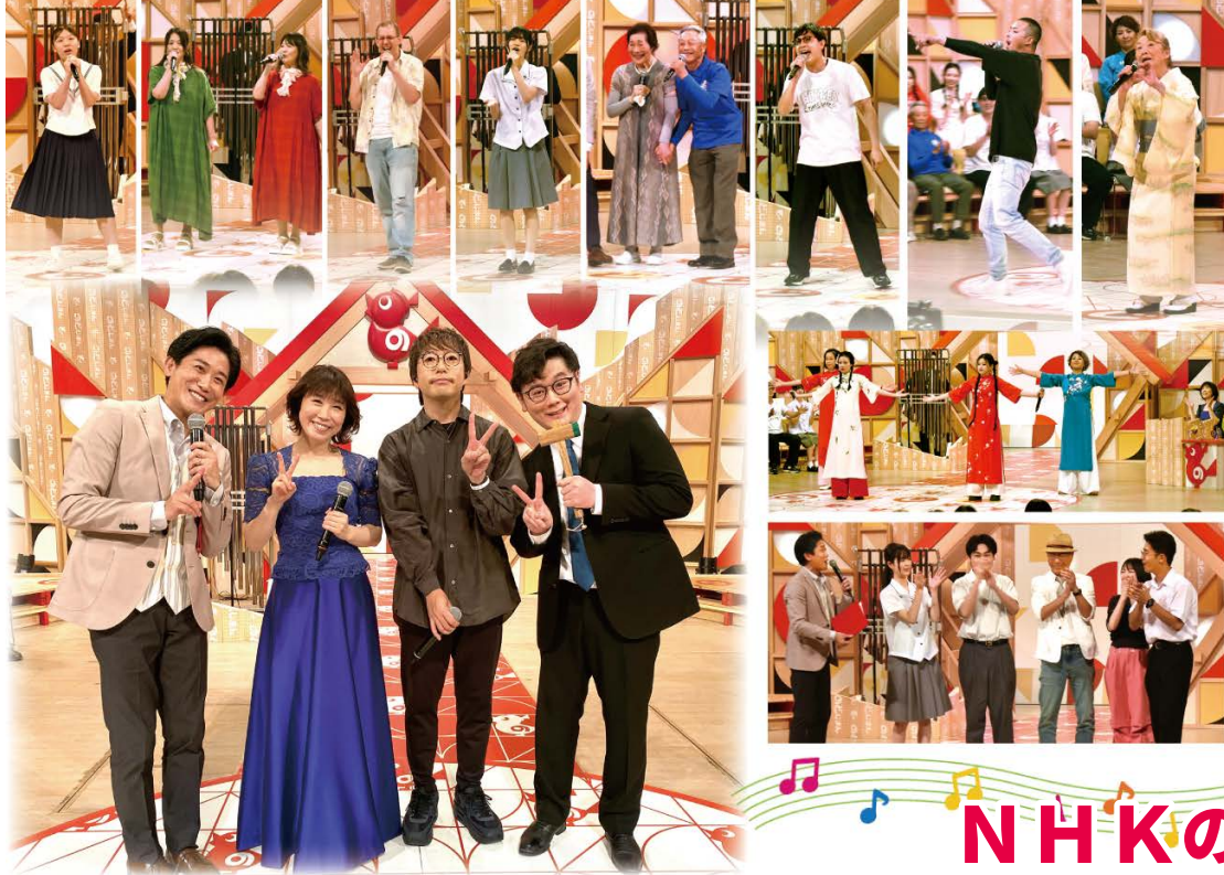
今回のチャンピオン