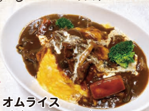
オムライス (ビーフシチュー) (エビのトマトソース)