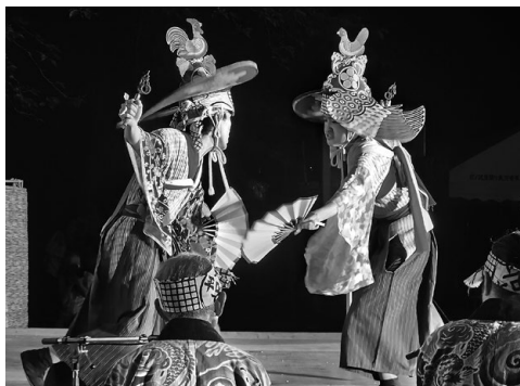
御神楽（下直根講中）

このうち、本海獅子舞番楽400年を記念し「御堂入（二階講中）」「鳥舞（八木山講中）」「品（下直根講中）」「鳥舞（平根講中）」の4演目では、保存伝承に尽力されてきた師匠たちによる「師匠公演」が行われ、長年培われた舞ややしに大きな拍手が