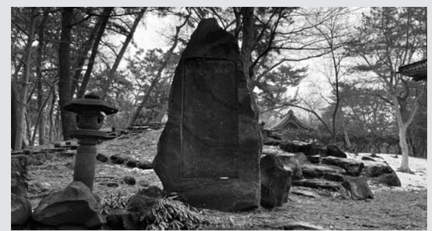
「甲午震災記念碑」。2021年3月に国土地理院の自然災害伝承碑に登録されました。

庄内地震は1894年10月22日17時35分頃に発生しました。地震の規模を示すマグニチュードは7.0で、飯森山が崩壊したほか、海岸沿い（浜中）で3メートルほど地盤が盛り上がった、という記録が残っています。酒田町（当時）だけで3300以上の家屋が全壊する、という大惨事になった理由の一つは火事でした。石油ランプが各家庭に普及し始めた頃で、夕飯の準備をしていたところを地震が襲ったため、各所で火事が発生したとされて