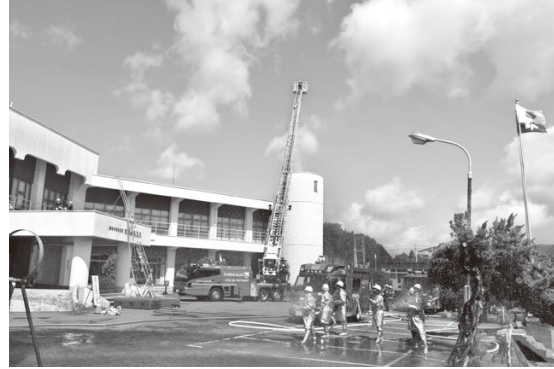
建物火災防ぎょ訓練の様子

訓練は、午前8時に秋田県沖を震源とする大地震が発生した想定で行われ、地震発生と同時に身の安全を確保するシエイクアウト訓練（低くしゃがむ・頭を守る・じっと待つ）が実施されました。訓練会場の一つである鳥海小学校と中学校では、生徒たちが水消火器による消火体験