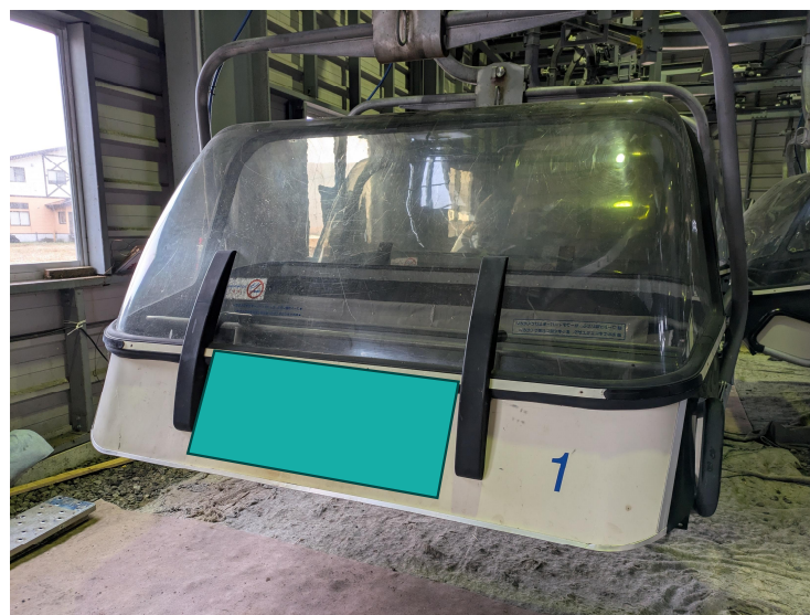
⑥リフト搬器フード（前面下部）