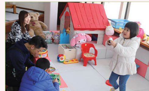
大平スキー場ヒュッテ内に玩具や絵本を設置した、子どもが遊べるキッズスペース