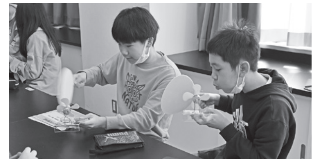
発電機に風を送り電気に変える実験の様子

がありました。 電気を起こす実験では、風車が回ることでメロディーが流れる発電機を使い、運動を電気に変える仕組みを体験。児童たちは、うちわや息を吹きかけて風車を回そうと頑張っていました。思うようにメロディーが鳴らず、安定して電気を作る難しさを感じていました。 このほかハンドルを回して発電する実験を行うなど、児童たちは楽しみながら再生可能エネルギーや発電について学んでいました。