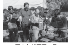
アウトドアフェス キャンプ飯の審査中