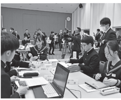
グループにわかれての協議の様子