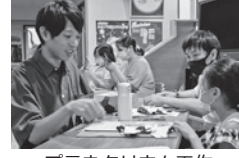
プラネタリウム工作 (8月10日・11日)