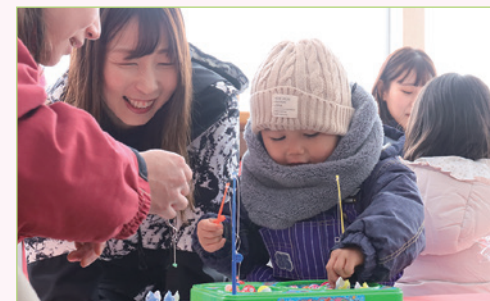
親と一緒にメンバーが子どもたちの遊びを見守る様子