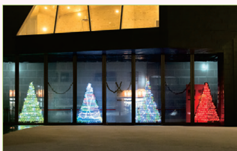
交通量の多い駅前商店街側のカダーレ入り口近くにイルミネーションを設置