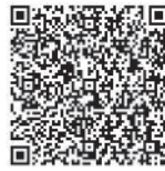
電子申請フォーム

公表資料閲覧場所 危機管理課、市ホームページ 提出期間 1月29日(月) 17時