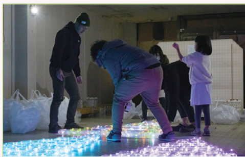
閉店した駅前商店のスペースを借り、組み立てや装飾作業を実施