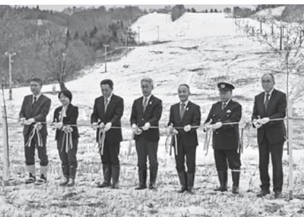
テープカットを行う関係者

鳥海高原矢島スキー場開きが12月14日に行われ、市やスキー関係者など約30人がシーズン中の安全と盛況を祈願しました。三森副市