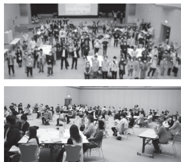
第1期全体会議の様子