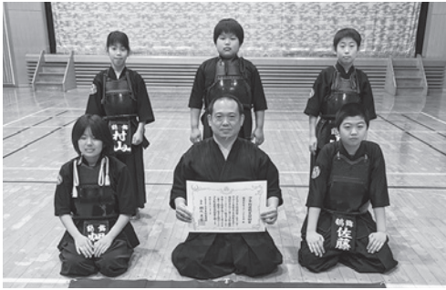
鶴舞剣道スポーツ少年団