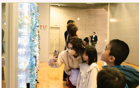
点灯式には協力を得た施設関係者や小学校の児童も参加