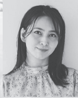
出身地 東京都府中市 加藤 夏希さん (38歳・東京都)