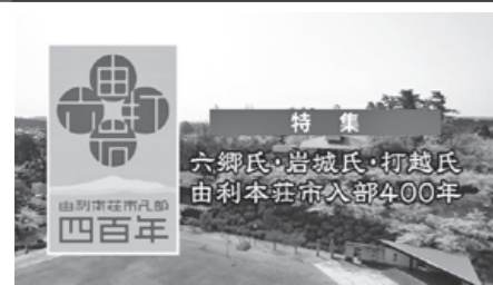
「特集 六郷氏・岩城氏・打越氏 由利本荘市入部400年」 12月29日(金) 8:00～ほか