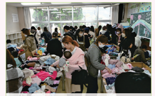
集めた千着以上の子ども服などをリユースし、約450人の来場者でにぎわう