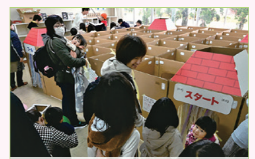
段ボール迷路、魚釣りゲーム、滑り台などの遊具を設置