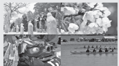
「ゆりほんタイム総集編～春夏秋冬～」 12月29日(金) 18:30～ほか

・予告なく番組の放送時間や内容を変更する場合があります。 ・放送する番組内容はEPG(テレビなどの電子番組表)やホームページからもご覧になれます。