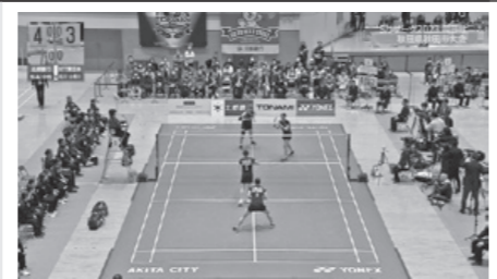
「バドミントンS/Jリーグ秋田大会」 北都銀行 vs NTT東日本 12月30日(土) 13:00～ほか