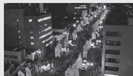
「秋田竿燈まつり」 ■妙技大会決勝 12月29日(金)13:00～ほか ■夜竿燈 12月29日(金) 20:00～ほか