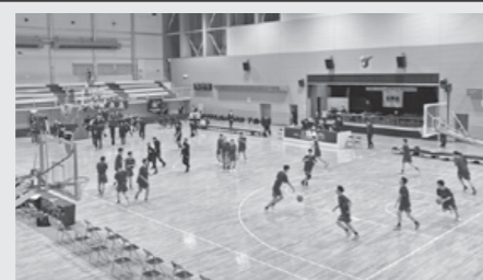
「ウィンターカップ2023 秋田県予選」 ■女子決勝「湯沢翔北 vs 秋田中央」 12月29日(金) 10:30～ほか ■男子決勝「能代科学技術 vs 秋田工業」 12月30日(土) 10:30～ほか