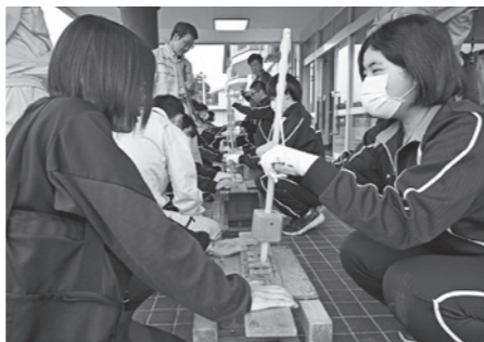
こすり合わせた木の摩擦熱で火を起こす「まいぎり式」に挑戦

生涯学習センターで縄文時代の東由利について学ぶ体験授業が開催されました。初めに、生涯学習課の講師から縄文時代の地域の様子や当時の人々の暮らしなどの解説が行われたほか、同地域の湯出野遺跡(県指定史跡)から出土した石器や土器を鑑賞しました。続いて、実際に発掘された縄文時代の道具を使用して当時の調理に挑戦する時間が設けられ、生徒たちは