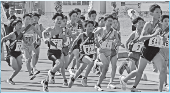
第1走者の小学生男子が正午にスタート (ナイスアリーナ前)