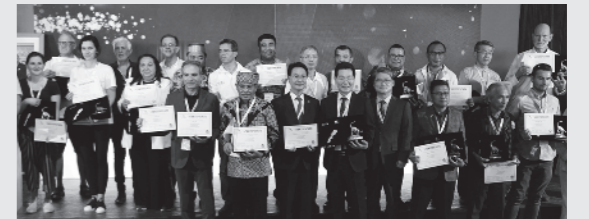
2020年～2023年に新規認定されたユネスコ世界ジオパークの認定証を手に、喜びを分かち合う大会参加者

ジオパークは、持続可能な地域社会を構築し、地域内の資源を未来に引き継ぐことを目的としたユネスコの正式事業です。しかし、この目的をかなえることは簡単ではありません。そのため、ジオパークの認定地域はネットワークを作り、互いの取り組みを共有しています。その重要な機会が、2年に1度開催されるジオパーク国際ユネスコ会議です。