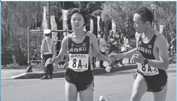
たすきをつなぐ本市選手たち(市役所前)