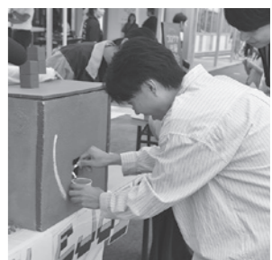
地域おこし協力隊「果樹農家になろうプロジェクト」の「蛇口からリンゴジュース」

市が官民連携を進めている「一番堰まちづくりプロジェクト」の一環として整備されたTDKの企業寮「ZINOBA」で9月30日、オープニングイベントが開かれました。一般開放されている食堂や共用スペース、屋外を中心に飲食や市産品などの物販、体験コーナーなどさまざまなブースが設けられ、多くの人でにぎわいました。地域おこし協力隊アベイバとナリワイの「石窯で焼くぼろたん栗のピザ作り体験」では、参加者らが慣れ