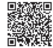
ゆりほんテレビ 公式YouTube

アンカーとしての自身のタイムは納得いかないものになってしまいましたが、レース中2人も追い越せた展開には満足しています。今回の結果をばねに高校駅伝など、ほかの機会に向けて自分に厳しく練習を続けたいです。