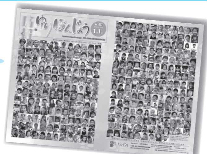
本年1月1日号の表紙・裏表紙