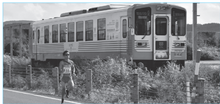
選手たちが由利高原鉄道を横目に疾走 (国道108号・子吉駅-薬師堂駅間)