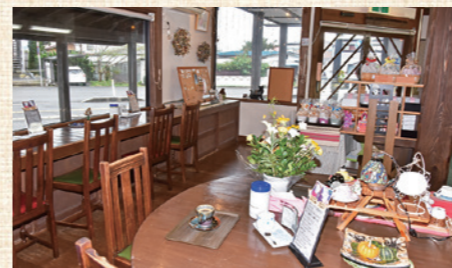
お客さんが1人でゆっくり落ち着けるように座席がレイアウトされた喫茶スペース

■こだわり 仕込みなどに朝から晩まで時間がかかるので、業者からは出来合い製品の使用を進められることもあるが、ほかの店と同じ味になっってしまうことを懸念し、既製品は一切使わずに全て手作りにしている。先代の頃から作られている定番商品も、作業の仕方や作業のタイミングを先代と変えるなど、自分のイメージ通りの味になるよう改善を重ねている。