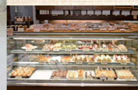
多くのケーキが並ぶショーケース

■おすすめ 「プリン」や「パリジェンヌ」が地元花立牧場のジャージー牛乳を使っている。おすすめは「バナナヌシヨコラ」「ガナッシュロール」「マローネ」などは先代の頃から40年以上作り続けている定番のケーキです。 ■よろこび 手間をかけて作っているので、お客さんに「おいしい」と喜んでもらえることがうれしいです。 ■これから お店を大きくするなどの考えはなく、いつまでもお客さんに喜んでもらえるように、今後も味を探求していきたいです。