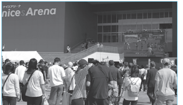
モニターで競技を見守る観衆