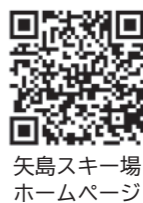
矢島スキー場ホームページ