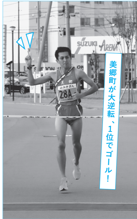
美郷町が大逆転、1位でゴール!