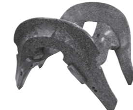
螺鈿鞍(本荘神社蔵) 修身館