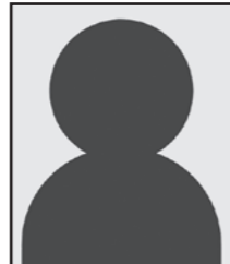
氏名 年齢 大字 ※年齢は8月1日現在