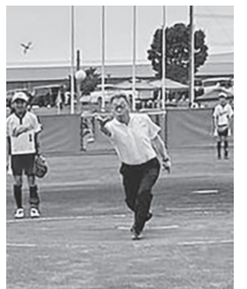
気分は…大谷選手？ (本荘ライオンズクラブ旗小学生ソフトボール大会始球式にて)