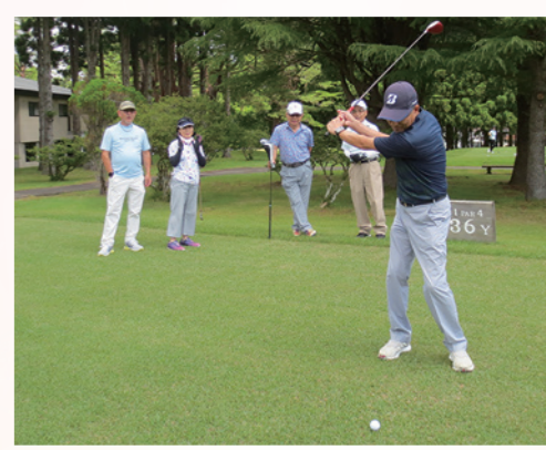
7月26日に行われたゴルフ場（秋田市）での活動の様子

で、約10きを4時間ほどかけて歩くことになりましたが、スコアに一喜一憂したり、会員同士の何気ない日常会話で親睦を深めながら、体を動かせることが本当に楽しいです」と語ります。