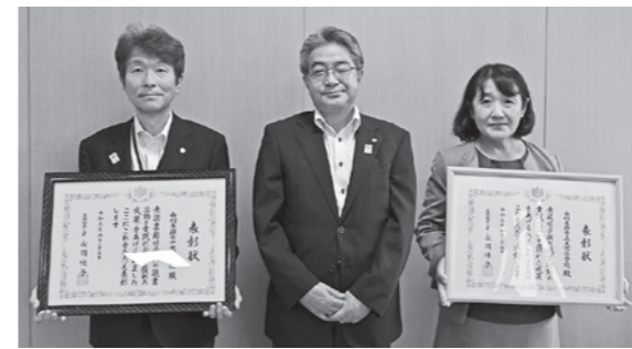
(写真左から) 越川図書館長、秋山教育長、佐藤校長