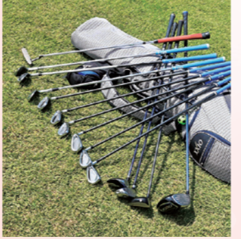
クラブごとに柄の長さやヘッド（先端）の形が異なり、状況によりそれぞれを使い分けます

■会のなりたち 同会は1983年に結成。会名には少しづつでも上達していき、みなでエース級の腕前を目指そうという意味が込められています。設立当初は8人から始まりましたが、初代会長が飲食店の経営者だったことから、同業者やお客さん同士のつながりで徐々に活動の輪が広がったそうです。現在では40代〜80代まで計32