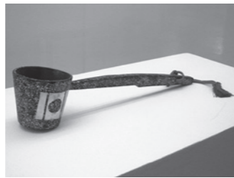
螺鈿柄柄杓 亀田城佐藤八十八美術館