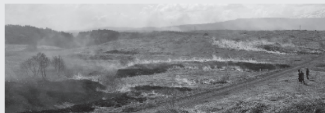
▲「冬師湿原」で5月ごろに行われる野焼き