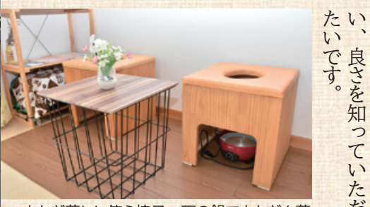
よもぎ蒸しに使う椅子。下の鍋でよもぎを蒸すと穴から蒸気が出てきて体を温めます。

おすすめ 今はよもぎ蒸しとお店オープン後に覚えた足もみがお勧め。よもぎ蒸しは穴の空いた椅子へ裸にマントを着て座り、下からよもぎを蒸すことで下半身から全身が温められ、体の代謝が良くなり、生理痛や便秘、肌などに良い。足もみは指や棒で足の裏のつぼを押すので痛みを感じるが、血行が良くなり体の疲れがとれ、全身の調子が整います。