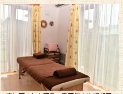
窓に囲まれた明るい雰囲気施術部屋