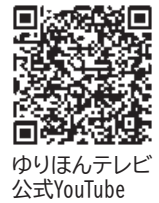
ゆりほんテレビ公式YouTube

各期成同盟会等合同整備促進大会を市内ホテルにおいて4年ぶりに通常規模で開催しました。 関係者約270人の出席のもと、「日沿道の整備促進」「河川整備と鳥海ダム早期完成」「羽越新幹線実現と羽越本線高速化」などの大会決議が採択されました。 各関係機関に要望してまいります。