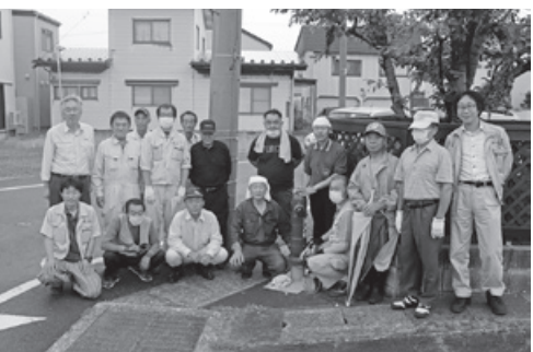
ワンハウス八日会の皆さん