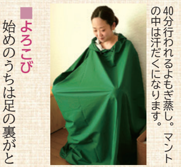
40分行われるよもぎ蒸し。マントの中は汗だくになります。

これから 足は一生使うものなので、全ての健康は足からとっています。より多くの人に足もみを体験してもらいたい、良さを知っていただきたいです。