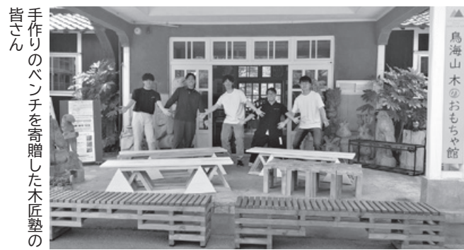
手作りのベンチを寄贈した木匠塾の皆さん

入館後の利用に限られていた「もりのなかにわ」に、屋外からの直接アクセスが可能な木製遊歩道を新設し、新遊具の「ブランコ」や「こどもかもしか」などを無料で楽しめます。 館内「もりのあそびば」には、本市の木匠職人が製作した木琴や太鼓のおもちゃで遊べる「がっきのへや」が登場しました。 無料ゾーンの民具展示室2部屋も展示替えをし、テーマごとに民具を学べるほか「本海流屋敷番楽」などの映像も放映しています。