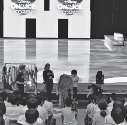
実際の衣装を手にする生徒