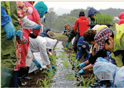
雨の降る中、親子で協力して行う野菜の苗植えを実施