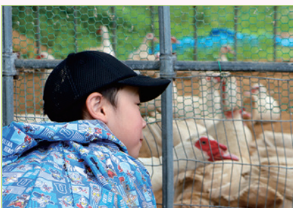
農作業終了後はフランス鴨農家の鳥小屋を見学

今回紹介するのは、東由利地域で家族向けの農業体験会を企画・実施した「東由利PM会」です。 「この活動に取り組んだのはなぜですか？」 東由利地域は1年に生まれる子どもの数が1〜2人と少子高齢化が著しいです。そのような状況でも、地域の魅力を多くの人に伝えたいと企画しました。地域の魅力の一つは盛んに行われている農業です。元々市内に「子どもと農業を体験したい」という声があったので、そうした声と地域の魅力を掛け合わせる機会を作ろうと思いました。 イベント名にもベテラン農家(シニア)の知見と参加する子ども(ジュニア)の感性を掛け合わせ、無限大の熱を生みたいという意味を込めています。