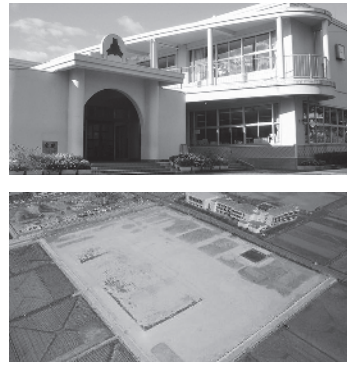
「鶴舞小学校」となる尾崎小学校校舎(上)と造成工事が完成した本荘東小学校敷地(下)

市および教育委員会では本荘地域学校再編委員会からの提言(本紙4月1日号12頁参照)を踏まえ、協議をした結果、基本的に提言内容を尊重することとし「本荘南中学校区統合小学校」の「校舎」については「尾崎小学校」を使用し「校名」については「鶴舞小学校」、新たに建設される「本荘東中学校区統合小学校」の「校名」については「本