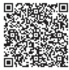
広報 ID 1008465

○名簿や応募による個人情報には厳重に管理し、投票立会人の選任事務以外には一切使用しません。