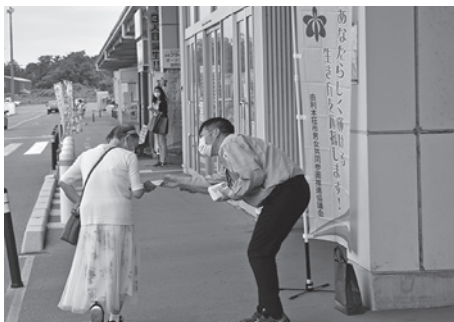
呼びかける参加者（6月27日本荘地域）

男女共同参画推進協議会委員やあきたF・F推進員、人権擁護委員、社会福祉協議会職員などの参加者らは、推進啓発チラシが入ったポケットティッシュを施設の利用者へ手渡ししながら、男女共同参画社会への理解を呼びかけました。