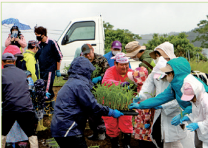
農作業に不慣れな参加者を地元農家や東由利PM会メンバーが支援