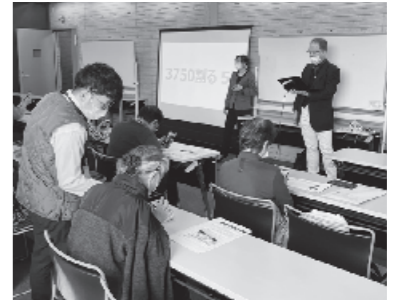
受講者全員が同じペースで学べます