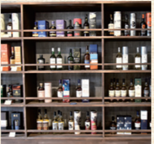
こだわりのウイスキーが並び商品棚の一部

キーがおすすめです、ウイスキーは県外からわざわざ買いに来る人がいるほど評判。数ある商品の中でイチ押しは市内8地域をイメージして作られた「ゆるいほんぼう」とコラボし、市内酒造から作ってもらった日本酒「萌酒」。大内キャラクターである「芋川さつき」がラベルに描かれている。