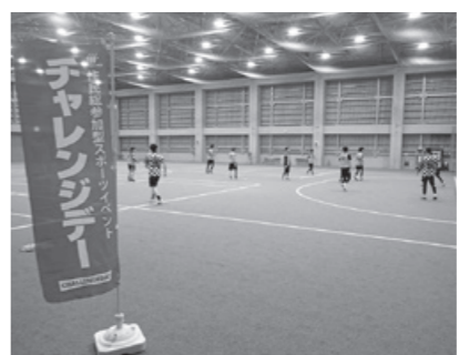
フットサル(ナイスアリーナ屋根付きグラウンド)

っかけ。なかなか思い通りにならないところがおもしろい。うまく行ったときは音が違うので分かる」と笑顔で話しました。 今回でチャレンジデー事業は終了しますが、市では今後も運動習慣の定着に向けたスポーツ事業を実施予定です。健康づくりのためにもぜひご参加ください。