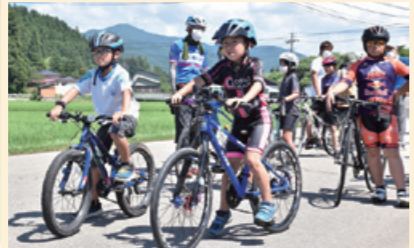
矢島カップMt.鳥海バイシクルクラシックの詳細は次号でお知らせします。

日時 7月29日(土) 14時～フリーマーケット、出店 18時～歓迎挨拶 ステージイベント 20時半～大抽選会 会場 矢島ふれあい公園 全国からライダーが集う「矢島カップ Mt.鳥海バイシクルクラシック」の前夜祭です。ステージイベントのほか、地域特産品があたる大抽選会を行います。 ☎やしま夏まつり実行委員会(市商工会矢島支所内) ☎56-2206