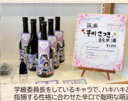
学級委員長をしているキャラで、ハキハキと指摘する性格に合わせた辛口で聡明な萌酒

年末には大内以外7地域の萌酒が発売予定で、市内3酒蔵が製造し、それぞれの地域キャラクターをイメージできるような味わいと、各キャラクターの好きな食べ物とマリアージュも楽しめるように準備を進めている。地酒を通して地域の魅力などを県内外の皆さまに知ってもらいたい。