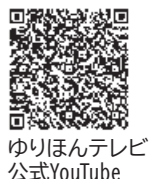
ゆりほんテレビ 公式YouTube

っかけ。なかなか思い通りにならないところがおもしろい。うまく行ったときは音が違うので分かる」と笑顔で話しました。 今回でチャレンジデー事業は終了しますが、市では今後も運動習慣の定着に向けたスポーツ事業を実施予定です。健康づくりのためにもぜひご参加ください。