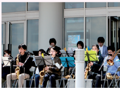
県立大学ジャズサークルによるライブステージ