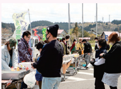
地元の企業や団体が協力した飲食や小物の出店