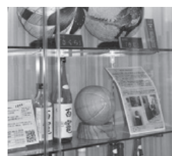
羽後本荘駅内に展示されている木製ボール