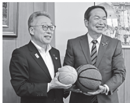
湊市長（左）と齊藤市長（右）

5月24日、湊市長が能代市役所を訪れ、齊藤滋宣能代市長とバスケットボールをイメージした地元工芸品を交換しました。両市では、人気バスケットボール漫画を原作にしたアニメ映画『THE FIRST SLAM DUNK（ザファーストスラムダンク）』の公開をきっかけに、漫画や映画の舞台となった場所などを巡る「聖地巡礼」のために訪れる観光客が増えています。