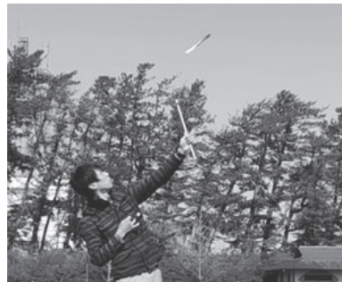
5月に子どもたちと「ミサイルロケット」を手作りして空へ飛ばすイベントを行いました。