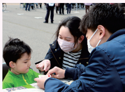
県立大生による親子で楽しめる木工や塗り絵のブース

今回紹介するのは、大内地域でのイベントを新たに企画・実施した「おおうち春まつり実行委員会」です。