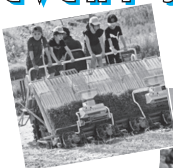
作業後の「朴の葉ごはん」は絶品！