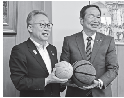
湊市長(左)と齊藤市長(右)

5月24日、湊市長が能代市役所を訪れ、齊藤滋宣能代市長とバスケットボールをイメージした地元工芸品を交換しました。両市では、人気バスケットボール漫画を原作にしたアニメ映画『THE FIRST SLAM DUNK(ザファーストスラムダンク)』の公開をきっかけに、漫画や映画の舞台となつた場所などを巡る「聖地巡礼」のために訪れる観光客が増えています。