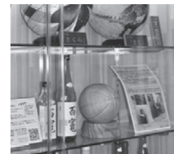
羽後本荘駅内に展示されている木製ボール