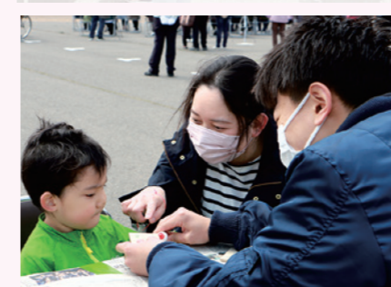
県立大生による親子で楽しめる木工や塗り絵のブース

今回紹介するのは、大内地域でのイベントを新たに企画・実施した「おおうち春まつり実行委員会」です。 「この活動に取り組んだのはなぜですか？」 大内地域で20年ほど前まで行われていた「芋川まつり」を復活させたいと思ったからです。お祭りがなくなつた後、大内地域全体が盛り上がるイベントがなくなつたことが気になっていました。また、県内外から来た県立大学の学生から、感染症の流行により地域でのサークル活動が十分にできず、由利本荘市内の人たちと交流する機会が全くないという話を聞いたことがあります。 そのような中で、市内に暮らす子どもや若者、学生が思い出す作り、地域に愛着を持てるよくなききっかけを生み出したいと思ひ、活動を始めました。 「どのよう活動に取り組みましたか？」 知り合いや県立大生などの協力を得ながら、準備を進めました。実行委員は2人ともイベントの企画は未経験で、試行錯誤しながらの作業は大変でしたが、多くの方々の協力のおかげで4月22日に開催できました。 当日は地元企業・団体による出店や、県立大生・由利高民謡部・岩谷保育園児・地元団体「踊らん会」によるステージのほか、子どもが気軽にスポーツや塗り絵、木工の体験などができるブースを設置し、千人以上の 「今後の目標を教えてください」 毎年このイベントを続けていくことです。芋川まつりと同じように花火を上げることを目標にしています。 地域の人たちからは「またやってほしい」「楽しかった」という声をたくさん聞くことができました。さまざまな世代に喜んでもらえるという手応えを感じています。 このイベントを続けていく中で素敵な思い出が作られ、大内地域を特別な場所だと思つてもらえたらうれしいです。若い世代が「この地域で暮らしたい」と思えるような活動をこれからも続けていきたいと思ひます。