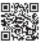
詳細は特設サイトへ

問い合わせ先 移住支援課 ☎24-6247 または公益財団法人秋田県ふるさと定住機構 ☎018-826-1731