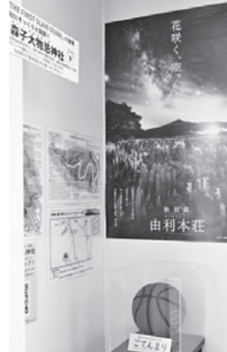
能代バスケットミュージアムに展示されているごてんまり

湊市長は「劇中に登場する神社のモデルと言われている森子大物忌神社にはゴールデンウイークだけで1500人以上が訪れた。より多くの方を呼び込めるように、これを契機に能代市と共通の取り組みなどを行い、相乗効果でにぎわいをつくりたい」と話しました。