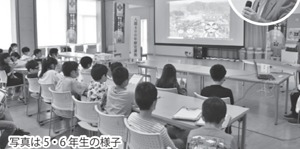
写真は5・6年生の様子