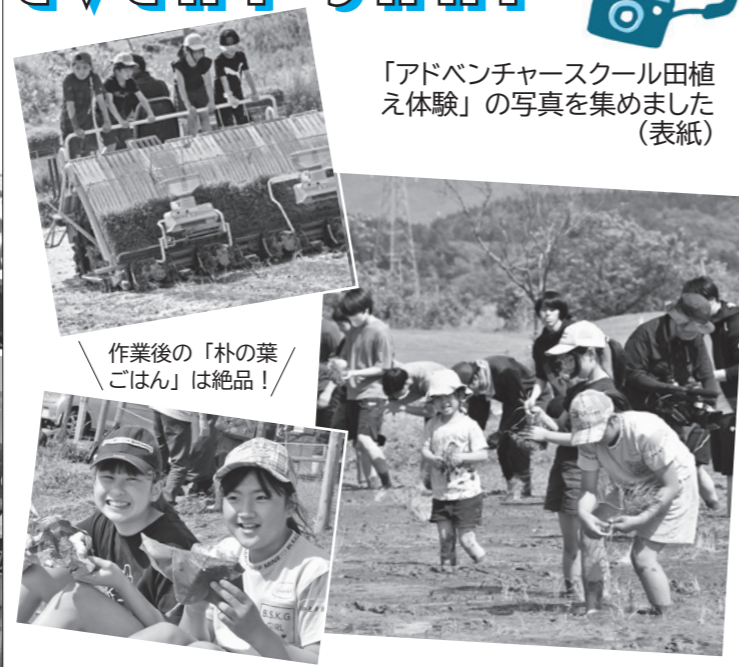
「アドベンチャースクール田植え体験」の写真を集めました(表紙)