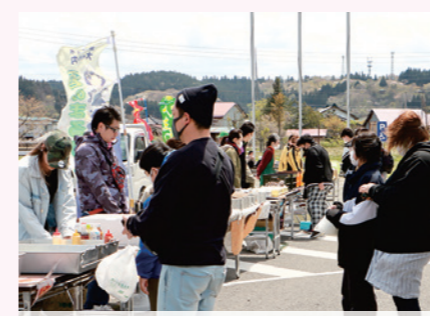
地元の企業や団体が協力した飲食や小物の出店