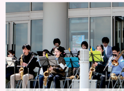
県立大学ジャズサークルによるライブステージ