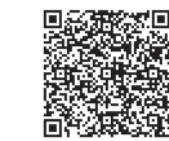
広報ID 1007911 (公開は4月15日～)

実施予定。詳細は本紙7月15日号でお知らせします。 行政職・技術職(土木)の「職務経験者試験」実施予定です。詳細は決まり次第本紙や市ホームページなどでお知らせします。