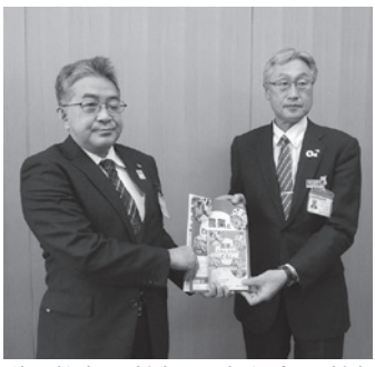
秋山教育長（左）と小松組合長（右）