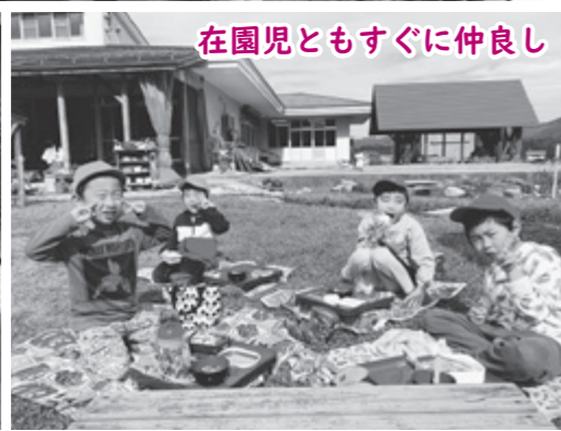
在園児ともすぐに仲良し