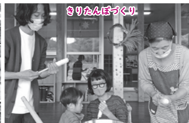
きりたんぼづくり