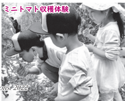
ミニトマト収穫体験