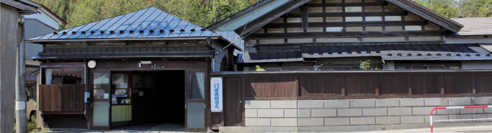
大正5年ごろに建築された和風の店舗(左)と主屋(右)