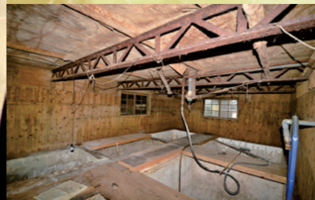
昭和32年建築の工場東棟旧諸味室のコンクリート桁槽