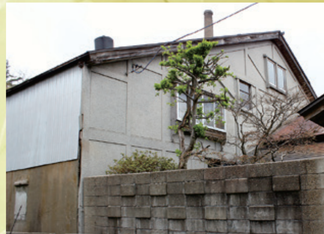
正面外壁の装飾が近代的な昭和前期建築の工場西棟

戦後、急激な都市化の進展などにより、江戸時代以降の多種多様な建造物が、その建築史的・文化的意義や価値を十分認識されないまま失われていくことが増え、この文化財建造物を守り、地域の資産として生かすため、文化財登録制度が作られました。登録有形文化財建造物は、50年を経過した歴史的建造物のうち、一定の評価を得たものを文化財として「登録」し「指定」文化財よりも緩やかな規制を通じて保存が図られ、各地でまちづくりや観光などに活用されています。本市の「旧鮎川小学校(鳥海山木のおもちゃ美術館)」は、その代表例です。