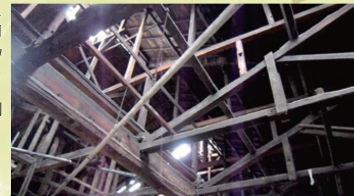
工場西棟の広大な屋根を支える洋風と和風の複雑な屋根の骨組み