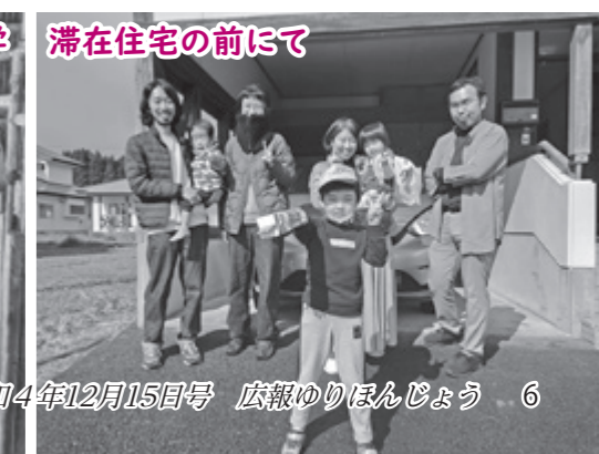
滞在住宅の前にて