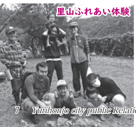
里山ふれあい体験