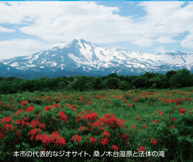
本市の代表的なジオサイト、桑ノ木台湿原と法体の滝