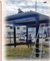
カーポートは、最大で積雪2トンまで対応可能

会社のモットーは「困り事を自分事として考えて提案すること」。お客様の話をよく聞くと、求めている商品ではなく、別の商品のほうが問題解決に最適だったりすること、社員の皆さんで心掛けています。最近よく目にするようになった住宅用カーポートも、積雪量や風の強さなどでおすすめる商品が違ってしまうので、じっくりと相談に乗ってから施工。丁寧な対話と高い技術力で、雪国の冬支度を簡単にできるよう整えてくれる(株)マサカ。冬のお悩みを抱えている方は、雪が降る前に一度、相談に行ってみてはいかがでしょうか。