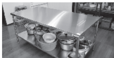
大倉沢報徳館に整備された調理作業台