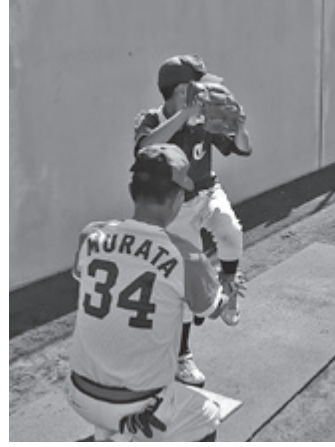
ピッチングを教わる団員

第28回セノン全国少年少女野球教室が、10月1日に水林グリーンスタジアムで開催されました。元プロ野球選手の三浦正