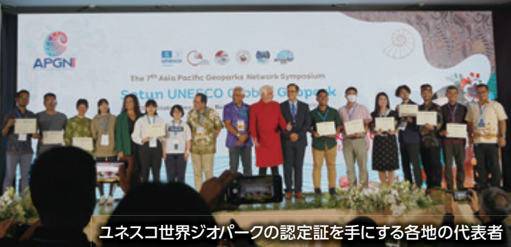
ユネスコ世界ジオパークの認定証を手にする各地の代表者