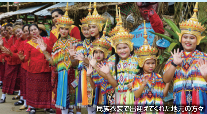
民族衣装で出迎えてくれた地元の方々