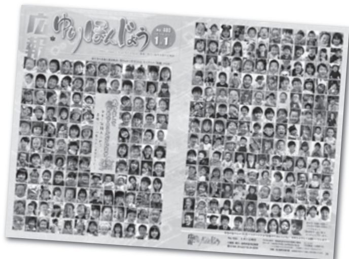
本年1月1日号の表紙・裏表紙

◆応募方法 下の二次元コードから電子申請フォームへアクセスし、「投稿者の氏名・住所・年齢・電話番号、被写体の方の氏名(ひらがな)・住所、広報紙にひとこと」を入力し、写真データを添付してお送りください