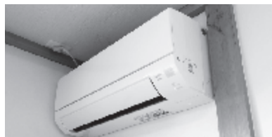
松美町公民館に整備されたエアコン

◎この事業は、宝くじの受託事業収入を財源とした社会貢献事業として実施されています。