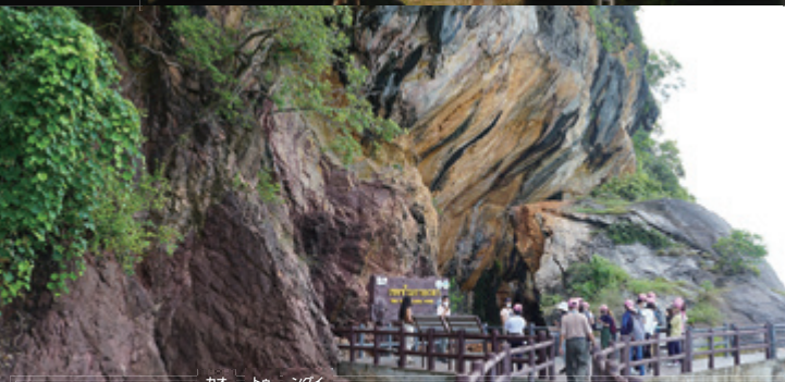
カオ トン グイ 地質サイトの1つ「Khao To Ngu」。古生代と中生代の地層が断層で接しています。

9月、アジア各地にあるユネスコ世界ジオパークが集うAPGNアジア太平洋ジオパークネットワークシンポジウムが開催されました。会場となったタイのサトゥーンにはタイ、インドネシア、マレーシア、ベトナムなどの東南アジアや、中国、日本、オーストラリアから約450人のジオパーク関係者が集いました。ユネスコの正式事業であるジオパークは世界48カ国、183カ所に存在します。国境や言語の壁を越えて交流したり、それぞれの地域での活動を学びあい、地球規模の保全活動を行うネットワークを築いています。現在、日本ジオパークに認定されている鳥海山・飛島ジオパークでは、ユネスコ世界ジオパークの認定に向けて取り組みを始めています。今回のAPGNへの参加は、世界に対して私たちの存在をアピールする初めての機会となりました。大会で行ったプレゼンテーションでは、にかほ市の九十九島における、地質的価値の保全とそこで行われる産業振興のためのほ場整備の取り組みについて紹介したほか、鳥海山・飛島ジオパークを構成する4市町の首長も参加し、各地の魅力を世界に発信しました。