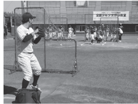
打撃投手としてボールを投げる元プロ野球選手

する場面もありました。教室終盤には今浪さんと3打席勝負を行い、子どもたちにヒットが出ると球場全体が盛り上がりました。