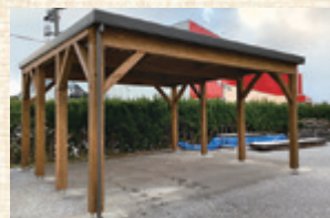
秋田県立大学板垣教授と産学共同開発した木製カーポート

7年ほど前からは一般家庭向けの受注も始め、ガラスの修理や交換、網戸の張り替えや作成、風除室やサニールームの施工や修理、玄関リフォームなど、アルミに限らず総合的な事業をする会社として社名を株式会社マサカとあらためる。現在の従業員は10人。そのうち4人いる営業職は全員が職人経験者のため、相談の段階から詳細な提案ができる。