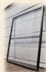
雪囲い用パネルの設置や

市内でも地域によって積雪量が大きく異なり、住宅の立地条件にも個性がある。冬に強い住まいづくりを提案できる会社として、一軒一軒の悩みに合った商品を提供できるよう、地域に根ざした会社であり続けたい。