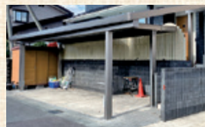
変形地に合わせたカーポート