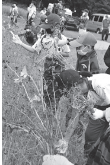
ソバを刈り取る児童ら

9月26日、鳥海小学校の3・4年生25人が直根学習センター（旧直根小学校）にあるソバ畑でソバの刈り