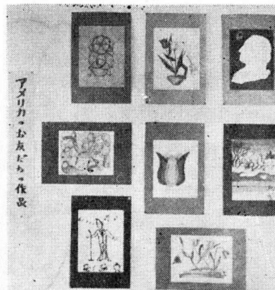
アメリカの生徒の作品

このほど玉米中学校にアメリカの生徒たちの図画四二点がおくられてきた。これと交換に同校生徒たちも作