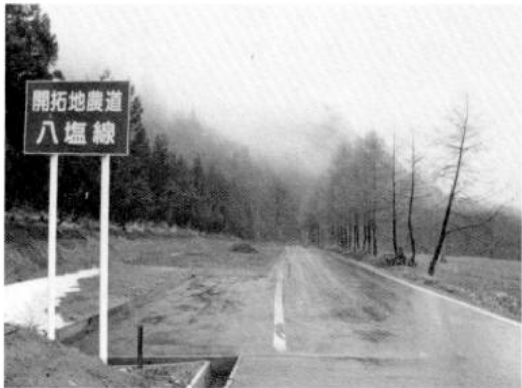
2,958メートルが整備された八塩線