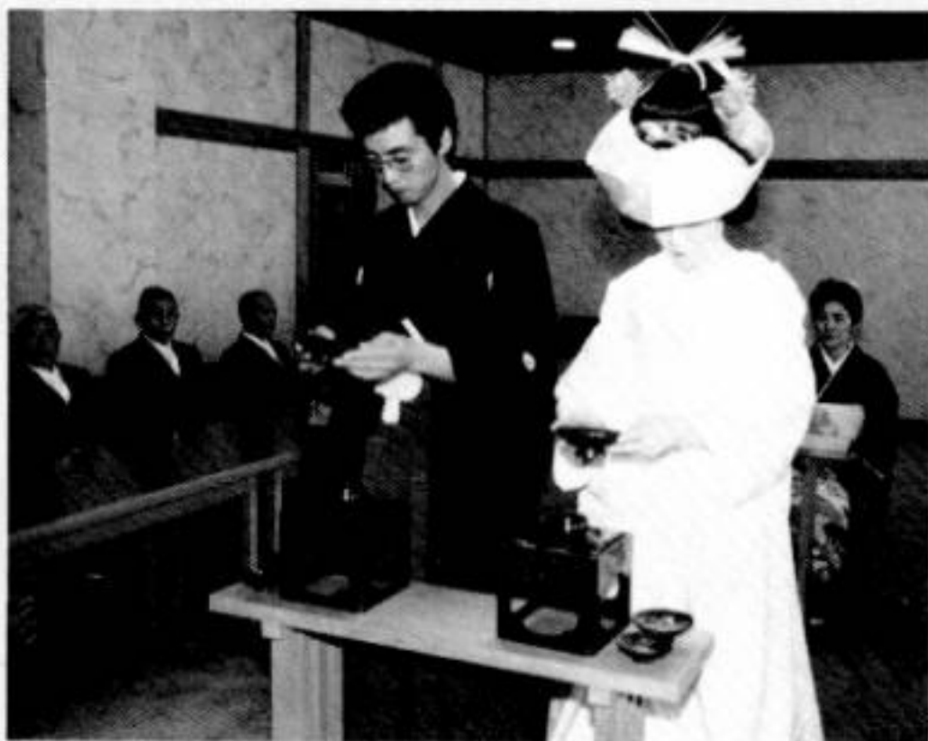
30歳以上の未婚男女にあなたのお力添えを...