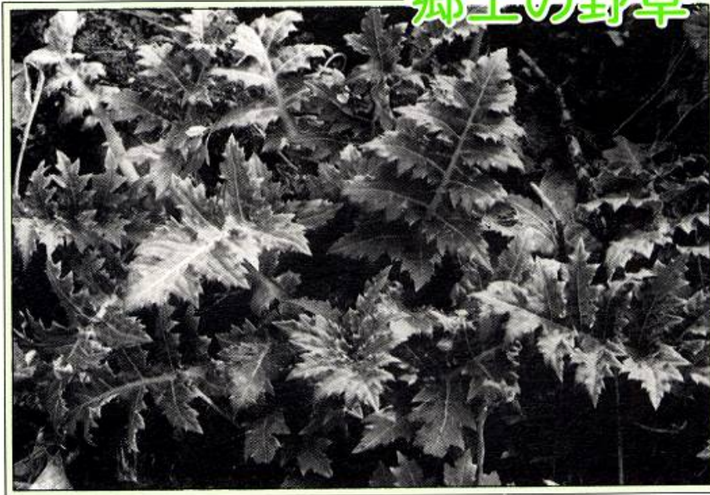
サワアザミ (キク科) ②6

4月上旬「これはゴボウアザミといって汁の実にして食べるとおいしい」といって町内のある方から浅緑色のアザミをいただきました。羽状楕円形の切れこみのある葉は、やわらかく、刺針も他のアザミのように痛くありません。汁の実にして食べてみるとアザミ特有のほのかな春の香りがして食欲をそそります。このアザミは和名をサワアザミといって滋賀県以北、北海道南部までの主として裏日本(日本海側)に多く分布し、常時湿った土の、あまり固まらないところを好んで群生するアザミで夏から秋にかけて1~2メートルにもなり紅紫色の独特の花をつけます。日本には約30種類のアザミがあるといわれていますが、これは裏日本を代表するアザミといっていいいでしょう。汁の実のほか、各種あえもの、天ぷら、おひたしなどにしてもよく、健胃、整腸の効果もあるといわれます。(小松忠正)