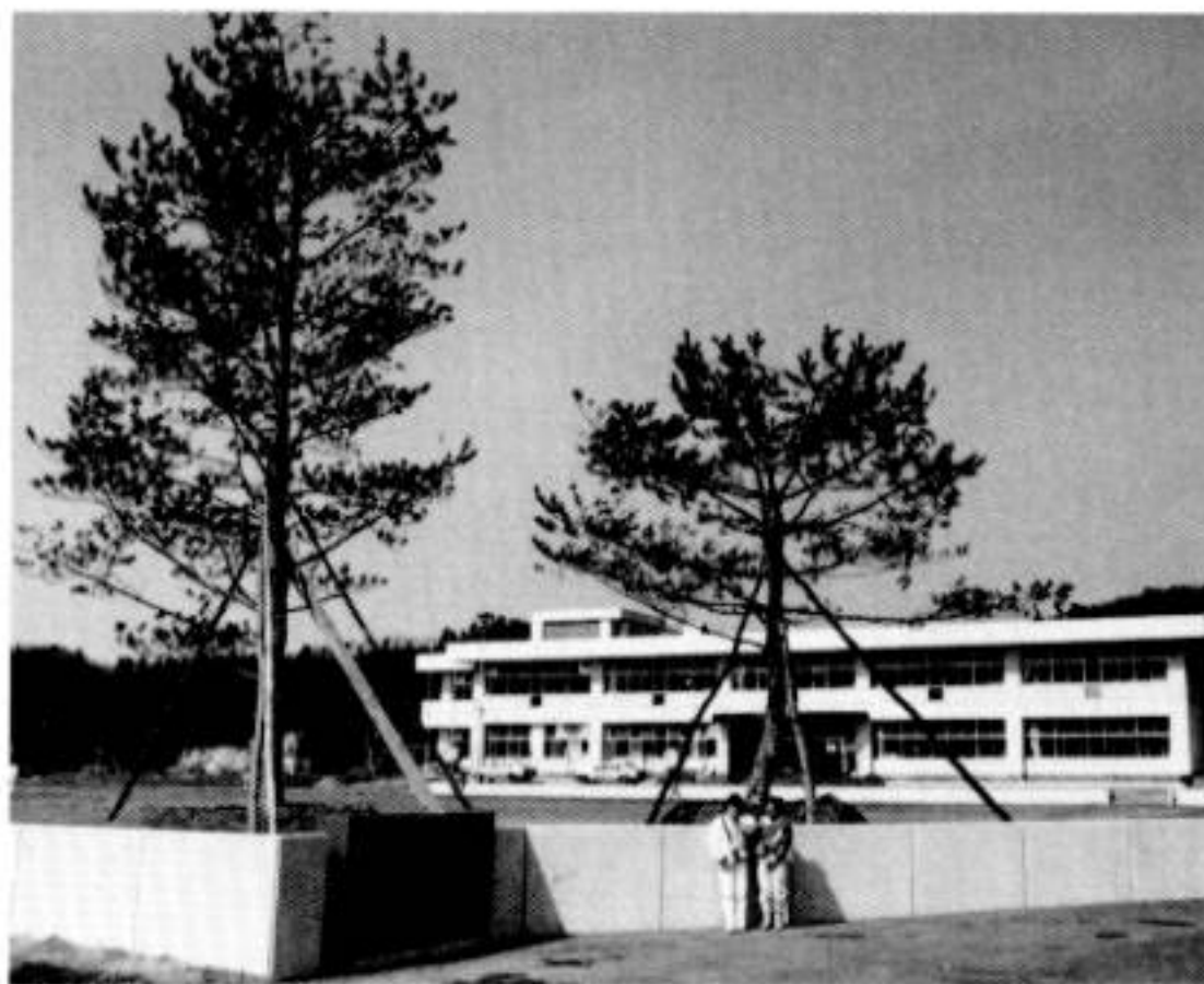
松の木によって学舎らしさがかもしだされた高瀬小校舎

宮の前・島地区の人たちが高瀬小の校門脇に四十年生の松二本とメタセコイアを植樹、樹木がなく寂しい感のした同校舎が松の木などによって一段と学舎らしさを現わしています。これは、宮の前・島地区の人たちが同地区に学校が立地したことを歓迎するとともに、今後校舎を地区のシンボルとしながら地域を発展させていこうとする気運により実現したもので、同校関係者はこの温かい奉仕に感謝しています。