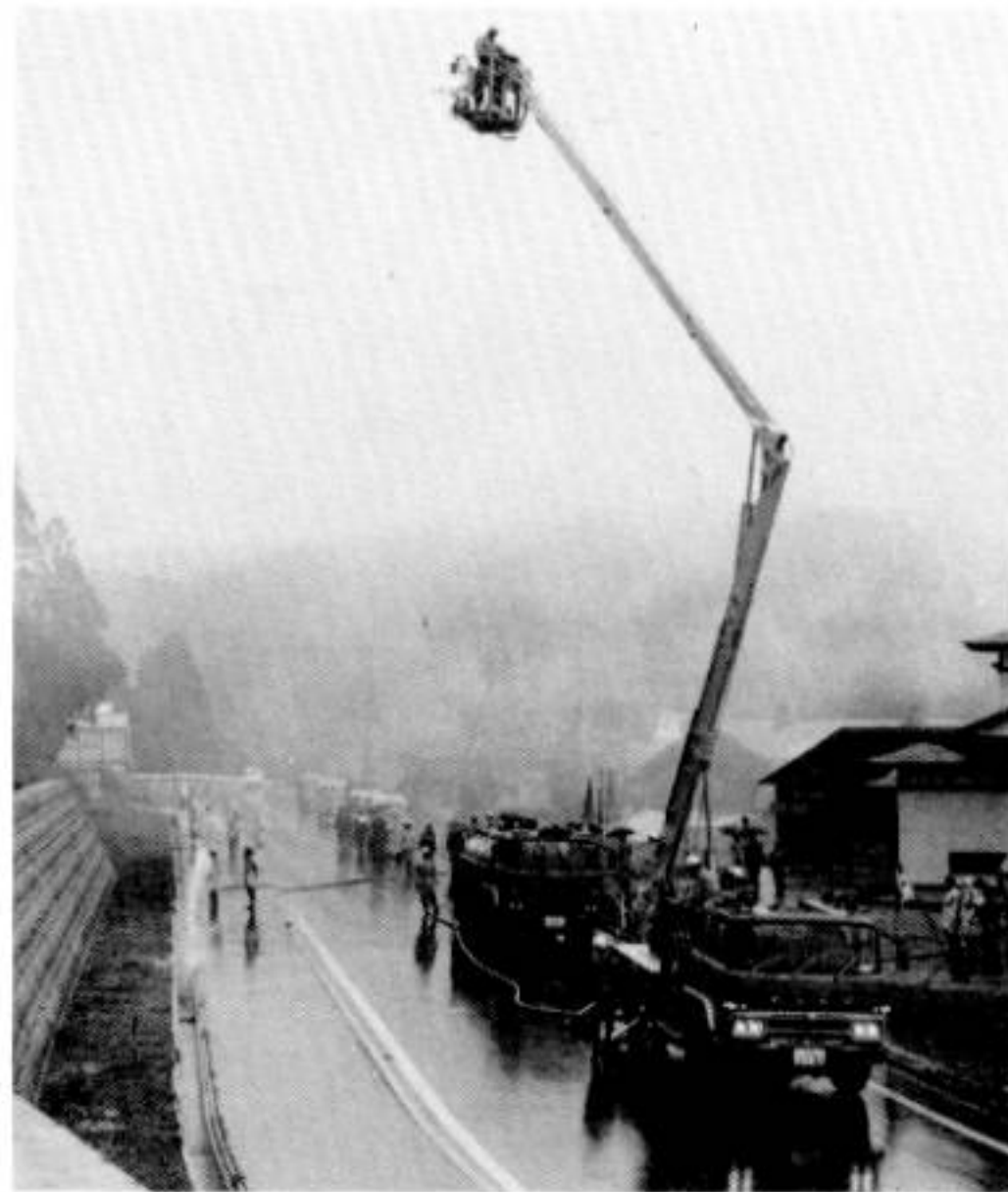
本荘署から出動した屈折はしご車

四月二十六日、春恒例の大火防止訓練が田代地区を会場に、町消防団員ら約三百人とポンプ車など二十五台が出動して行われました。当日はあいにくの雨模様でしたが、同訓練としては初めて本荘署から屈折はしご車が出動するなどスケールの大きな訓練となりました。