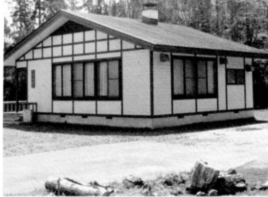
57年に建設された杉森会館