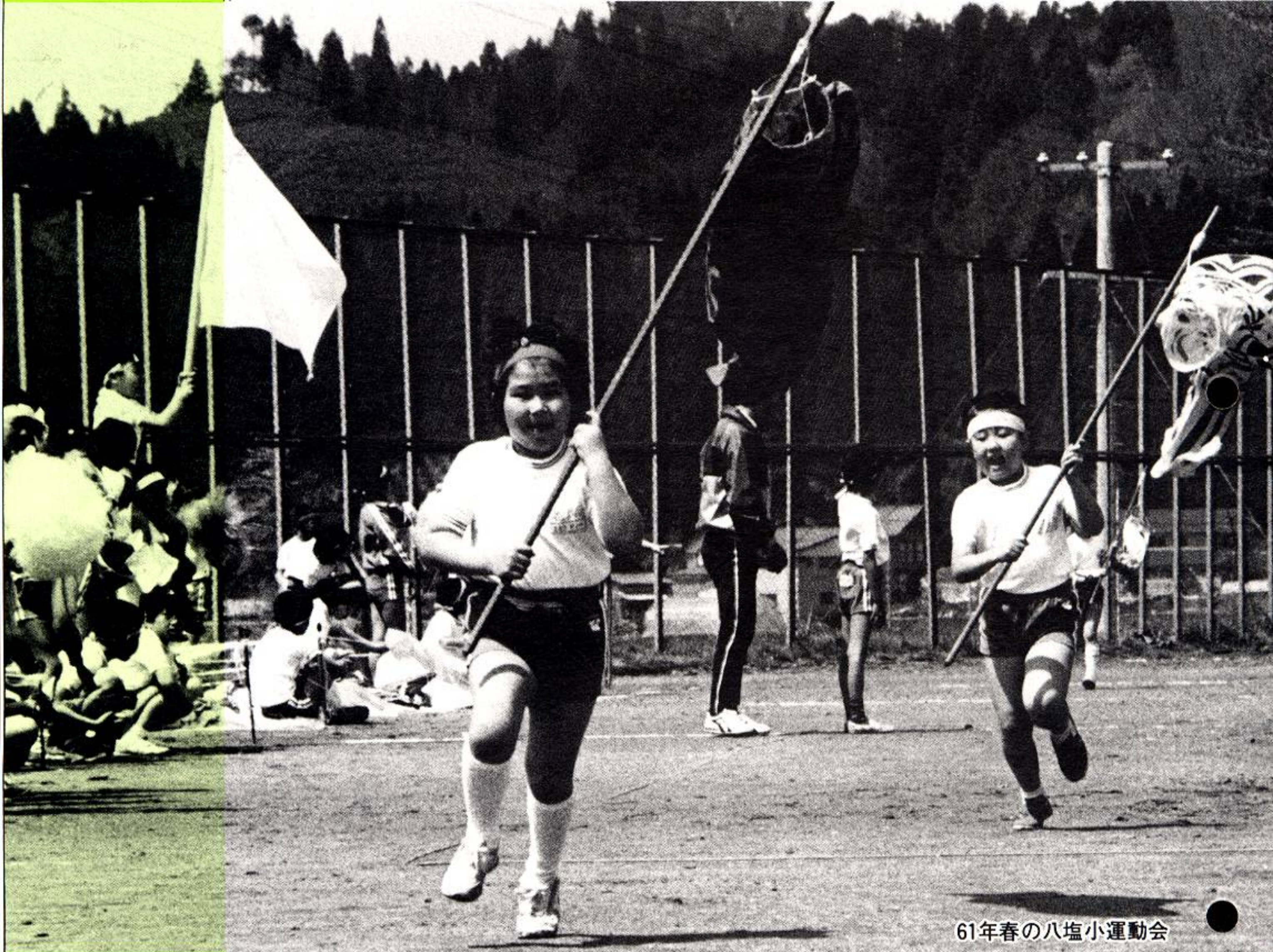
61年春の八塩小運動会