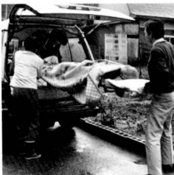
デイサービスで東光苑に向かうお年寄り（61年10月）

サービスを受けるには申込みが必要です。地区の民生委員が役場民生係にご連絡ください。