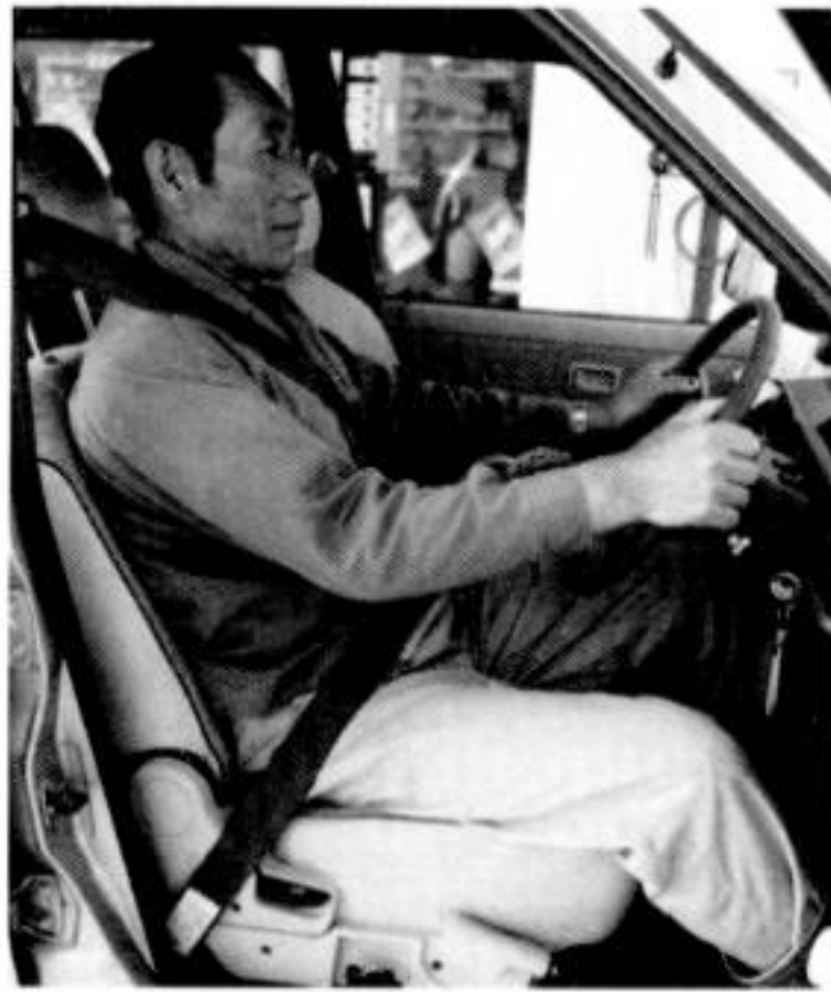
シートベルトはあなたの “いのち”を守ります